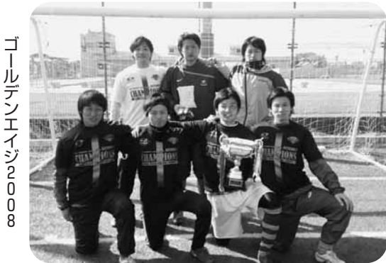
ゴールデンエイジ2008

第37回九州各県リーグ決勝大会は1月12、13日に沖縄県総合運動公園陸上競技場などで開催。熊本県代表の嘉島サッカークラブは善戦しましたが、準決勝で敗退、九州リーグ昇格はなりませんでした。 1回戦はMD長崎戦に3-1で勝利し、翌日の準決勝に進出。準決勝では、上位2チームに与えられる九州リーグ昇格の権利をかけてMSUFC（宮崎）と対戦、序盤から持