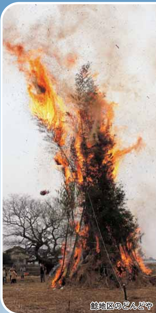
鯉地区のどんどや