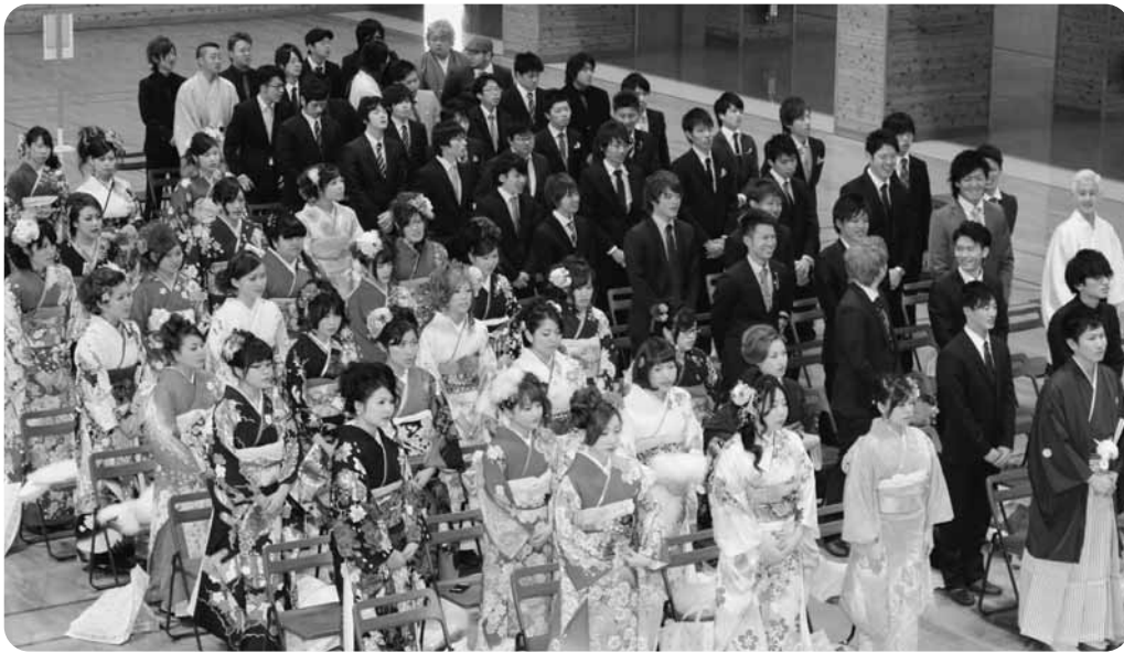
社会人として新たな一歩を踏み出した新成人

嘉島町の成人式は1月12日、町民体育館で開かれ、来賓や家族が門出を祝う和やかな雰囲気の中、華やかな晴れ着に身を包んだ新成人が社会人としての新たな一歩を踏み出しました。今年の新成人は97人（男性53人、女性44人）。式には84人が出席しました。