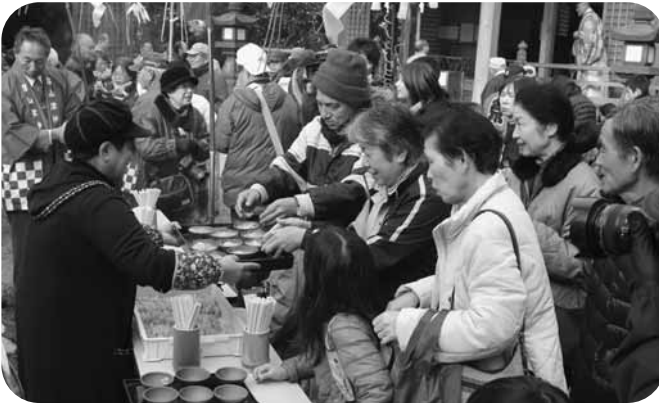
参拝者に振る舞われる七草がゆ