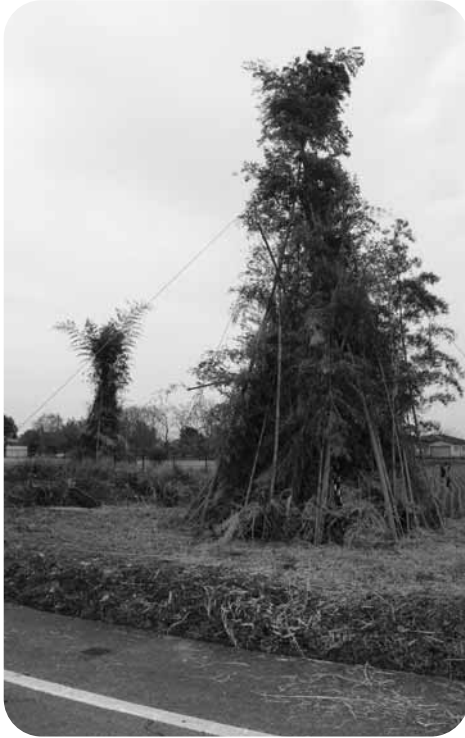
2つのやぐらが並んだ上六嘉地区

(とうと) や尊 (とうと) が なまったものとも、どんど 燃える様子からとも言われま