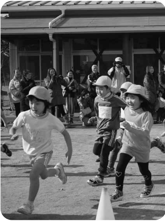
保護者の声援を受けて元気いっぱい

嘉島幼稚園のマラソン大会は1月15日に開かれ、園児たちは一生懸命に走りました。同園の冬の恒例行事で、年少の3歳児のたんぼ組は園内を、年中のすみれ組と年長のさくら組は園庭から隣接の嘉島中