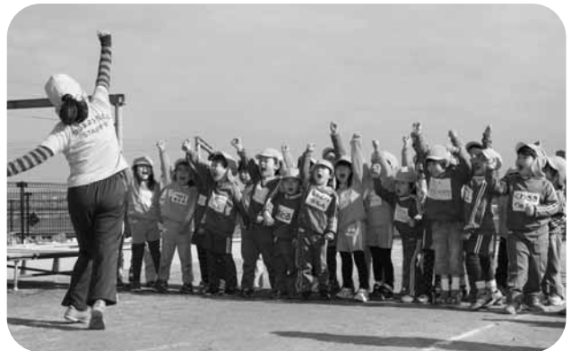
「すみれ組、がんばるぞ！」