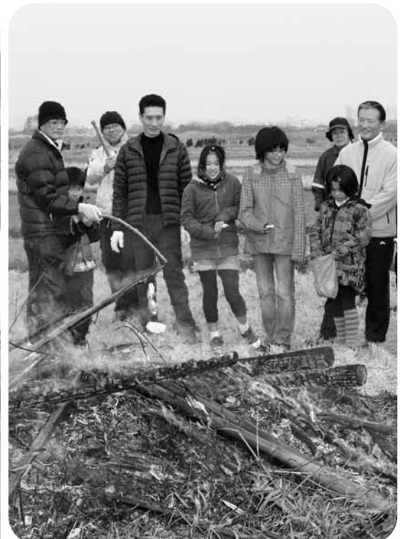
残りの火を囲んで和やかな雰囲気 (上仲間)