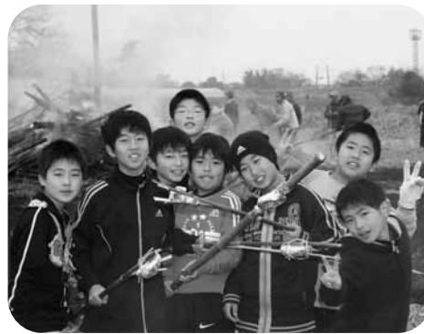
準備万端。張りきる子どもたち (鯨)