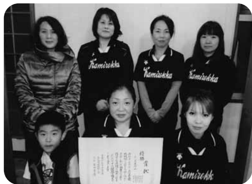
優勝した上六嘉Aチーム

ち前のプレスで試合を優位に進めましたが、1-1からのPK戦で敗れ、惜しくも九州リーグ昇格を逃しました。 ゴールデンエイジ優勝 新春5人制 サッカー大会 嘉島町体育協会サッカー部主催の新春5人制サッカー大会は1月19日、嘉島町スポーツ交流広場で行われ、9チームが熱戦を展開しました。 決勝はゴールデンエイジ2008とKTPの対戦。嘉島クラブ若手主体のゴールデンエイジがKTPを寄せ付けず、2対0で勝利、2014年のチャンピオンに輝きました。