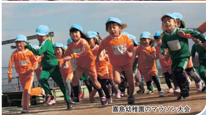
嘉島幼稚園のマラソン大会