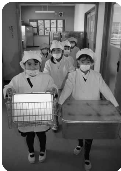
エプロンに帽子、マスクをつけて 給食を運ぶ当番の児童たち。 この日のおかずはタイピーエン。