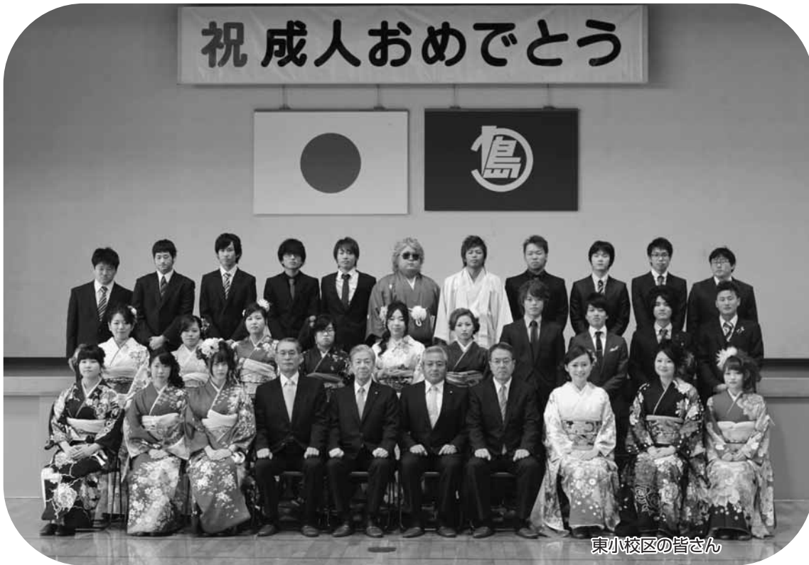
東小校区の皆さん