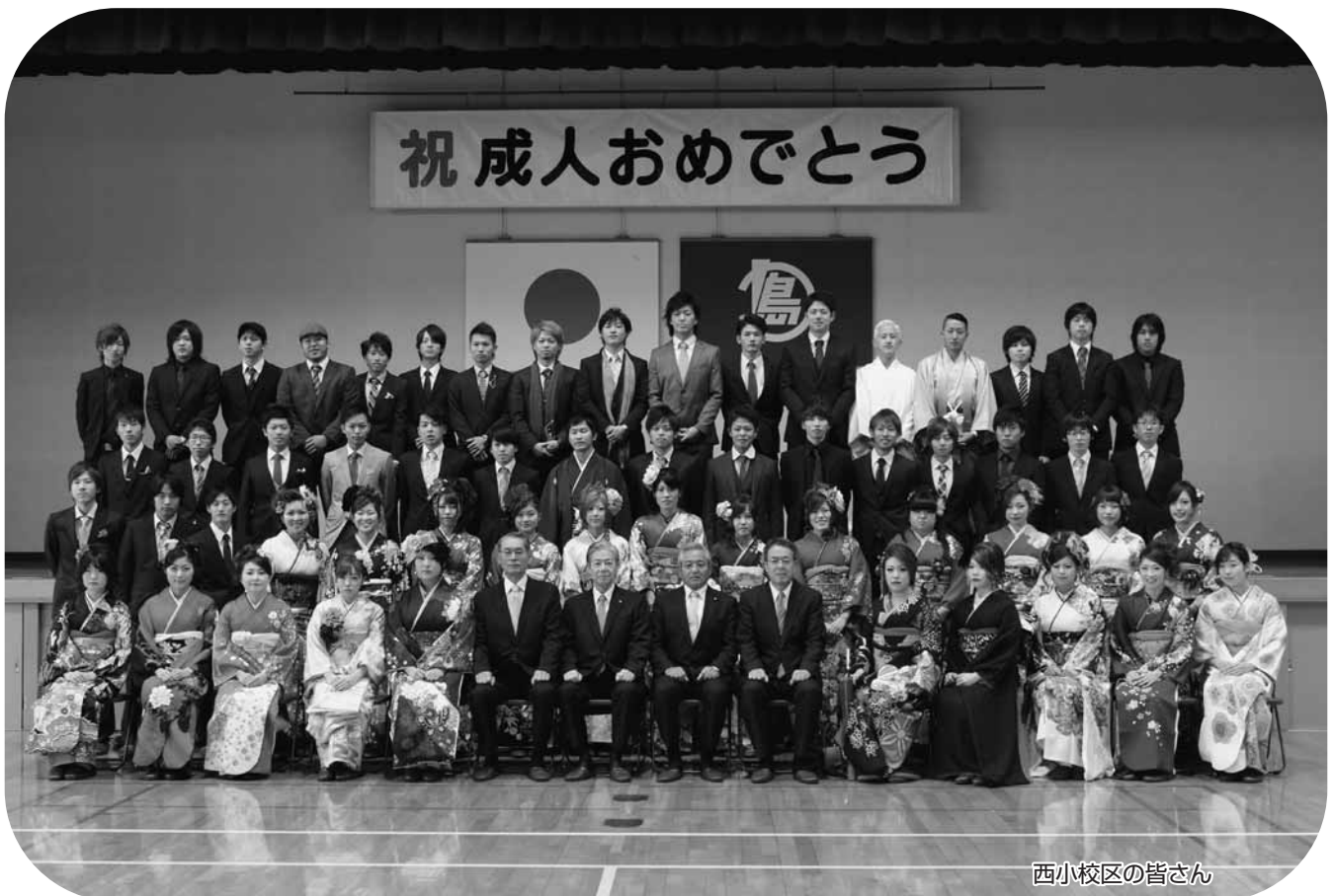
西小校区の皆さん