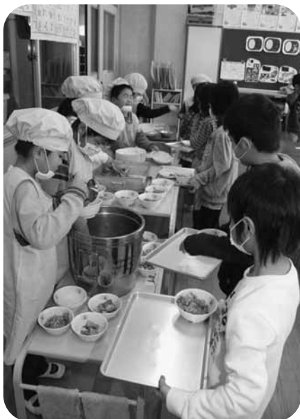
「残さず食べよう」と おかずのがめ煮をつぎ分ける 当番の児童たち(西小)