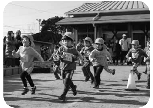
マイペースで行こう！