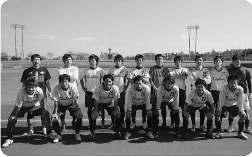
1回戦勝利後の嘉島サッカークラブ（沖縄県総合運動公園）