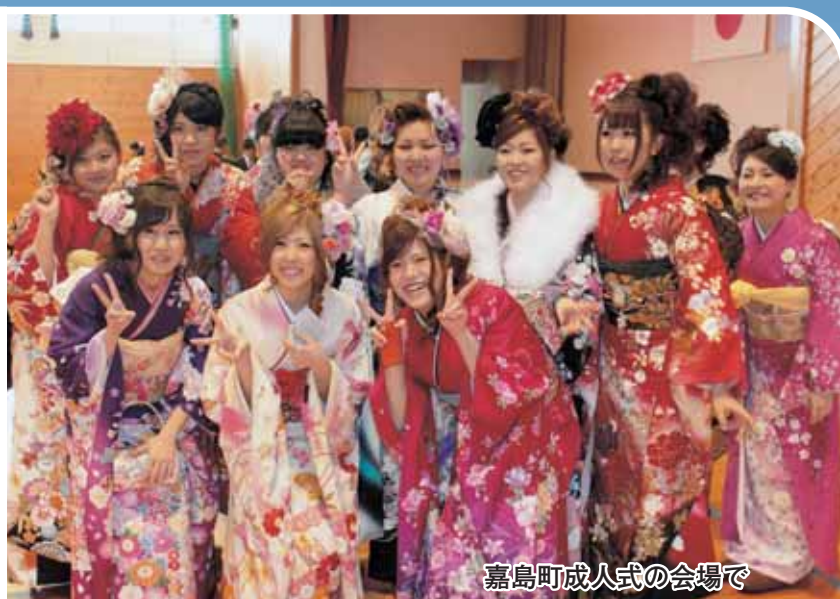
嘉島町成人式の会場で