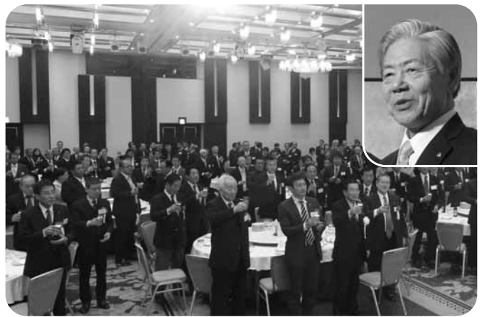
県商工会連合会の新春祝賀会

乾杯の音頭では「今年が本格的な景気回復の年になるように」と話しました。4月の消費税増税を乗り越えて、願いが実現することを切に願っています。