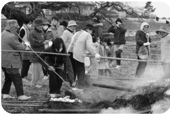
熱さをかまんして餅焼き (鯨)

町内では、子ども会や親子 会を中心に地区や消防団あげ て行うところや、隣組単位で するところも。子どもや大人 が見守る中、竹やわらなどで 組み上げられたやぐらに火が 付けられると、数分で炎が高 く上がりました。