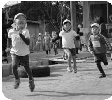
もうすぐゴールだ！