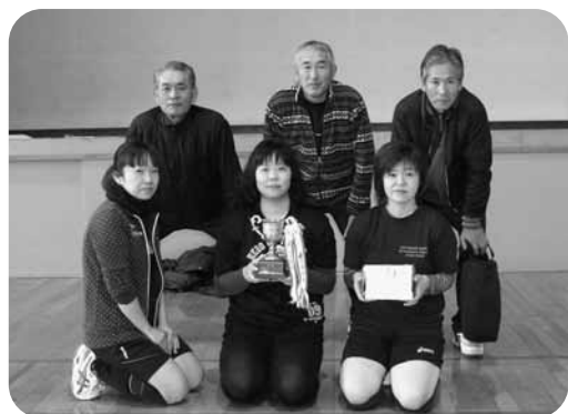
優勝した水曜会チーム