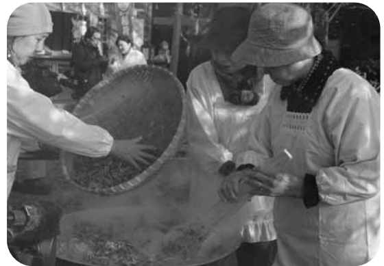
大釜で調理される七草がゆ

ありました。拜殿前の一角には七草も展示され、参拝者がかゆを食べながら説明文を読んでいます。