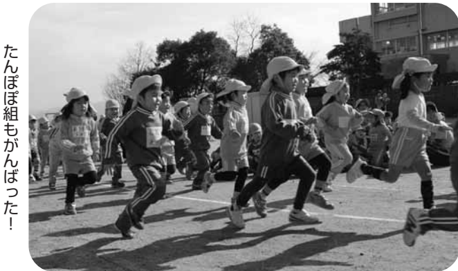
たんぼ組もがんばった！