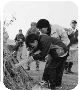
子どもが着火 (上六嘉)