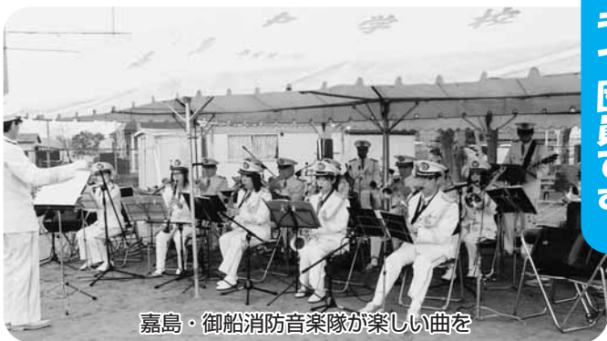
嘉島・御船消防音楽隊が楽しい曲を