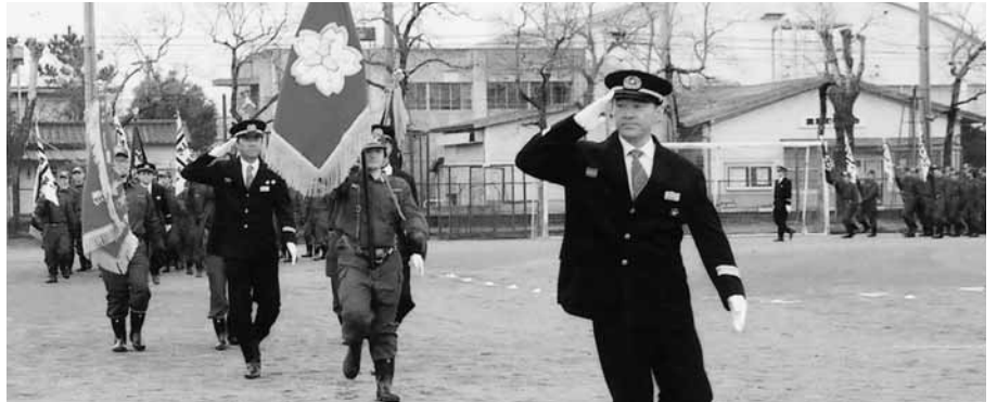
団長を先頭に堂々の入場行進