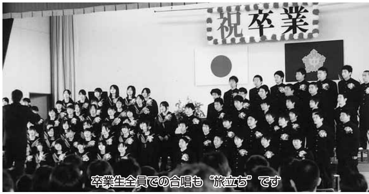
卒業生全員での合唱も「旅立ち」です