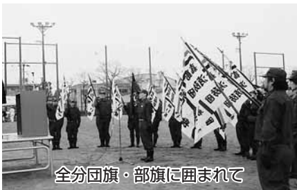
全分団旗・部旗に囲まれて