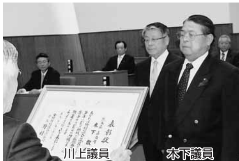
在職15年以上で地方自治に貢献されました