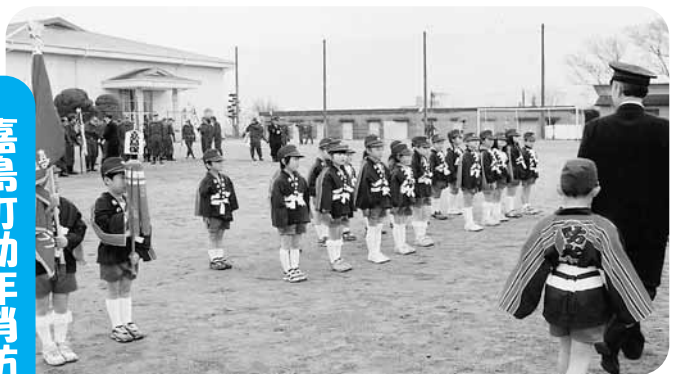
嘉島保育園幼年消防クラブ