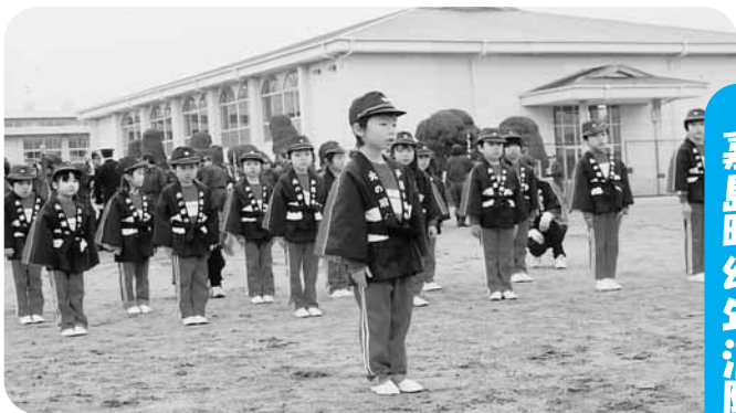
幼光保育園幼年消防クラブ