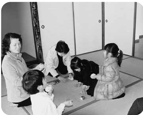
“昔の子どもたちの遊びはね”

子どもたちが集まればわいわいやっていた昔のなつかしい遊びを今の子どもにもその楽しさを体験してもらおうと東小学校の1年生を対象にした「昔遊び大会」が3月7日クラブハウスで行われました。先生は地元の大先輩のみなさん。竹馬、お手玉、羽子板、めんこ、けん玉などをそれぞれに別れて、いっしょに遊びます。子どもたちはじめての遊びだけに、なれない手付きで教わっていましたが、だ