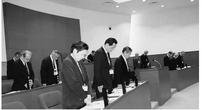
町議会で震災犠牲者に黙祷を捧げる幹部職員

東日本大震災は自然の脅威をまざまざと見せつけました。多くの人命が奪われ、営々と築いてきた暮らしも、一瞬のうちに灰燼に帰した方々の無念を思えば胸が痛くなりなます。私共の町も水との闘いに明け暮れ、それを克服した歴史を持っていきます。自然と正面から向きあうにはどうすればいいかを改めて考えさせられました。 町としても直ちに義援金を届け、役場玄関に募金箱を設置しましたが、出来るだけの応援をしたいと考えています。ご協力下さいますよう。