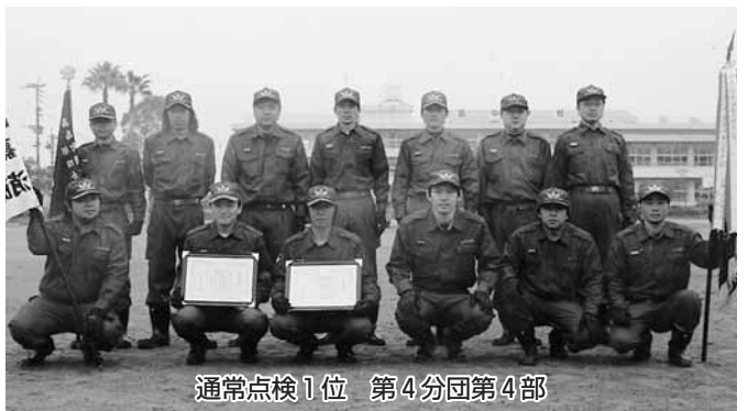
通常点検1位 第4分団第4部