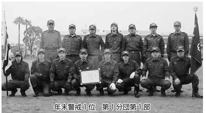
年末警戒1位 第1分団第1部