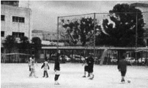
ALT's and local children playing soccer in the park 公園でサッカーをしているALTたちと地元の子供たち

ご存知のように、日本の東北地方は3月11日に巨大な9.0の大地震の打撃を受け、大津波があとに続きました。津波は、岩手、福島と宮城の海岸線に沿って全ての村を破壊しました。書いている時点で、死者数はおよそ9000、数千人以上が負傷または行方不明者です。この天災と結果として生じた原子炉の危機は、日本を最近で最も弱体化国家にしました。