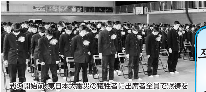
式の開始前、東日本大震災の犠牲者に出席者全員で黙祷を