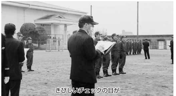
きびしいチェックの目が