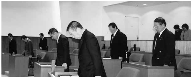
東日本大震災の犠牲者に黙祷を捧げました（3月14日）