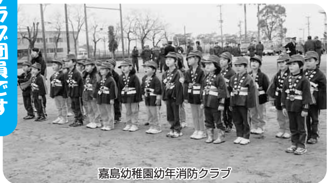
嘉島幼稚園幼年消防クラブ