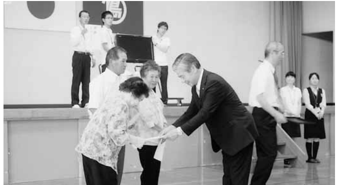
敬老会の抽選で、液晶テレビ大当たり！

東日本の大震災、近畿地方の豪雨と自然との闘いに心を痛めた地方が多い中、幸いに九州の恵まれた自然環境で実りの秋を迎えました。わが町の秋の恒例、敬老会、金婚式、ひとり金婚と確かな人生を送られている方々とお会いしましたが、家庭生活では女性パワーが圧倒している感じで、なでしこジャンプの活躍も納得できる現象の一つでしょう。心強い反面、どんと胸を叩いて「任せておけ」と男性パワーを発揮するのは何か、を改めて感じた次第です。