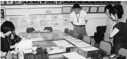
あたたかい審査です