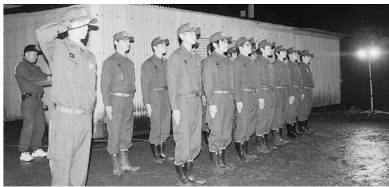
巡視の町長に報告（第1分団第1部）

火災や犯罪から町民を守るため、嘉島町消防団による年末警戒が12月28、29日の2日間実施され、初日には町長らによる巡視激励が行われました。各部の詰所で団員が整列し、部長の「只今、年末警戒中！異常ありません!!」と気