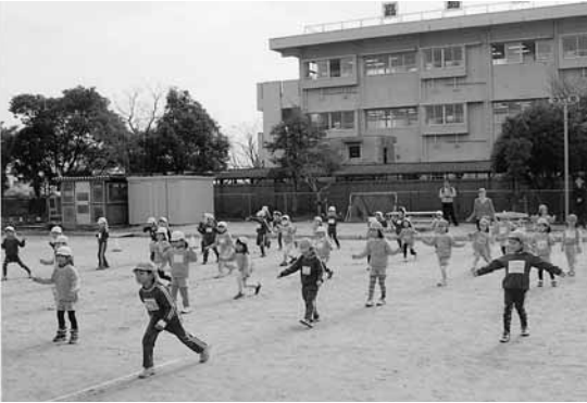
準備体操もばっちり