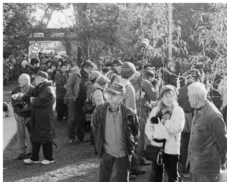
“おかゆ”に長蛇の列