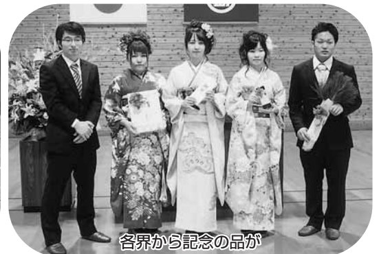
各界から記念の品が