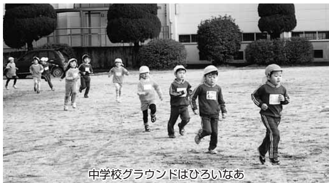
中学校グラウンドはひろいなあ