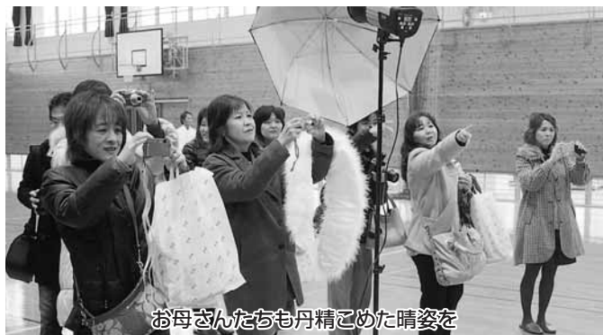
お母さんたちも丹精こめた晴姿を