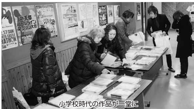
小学校時代の作品が一堂に