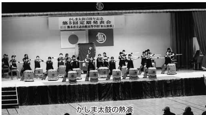
かしま太鼓の熱演