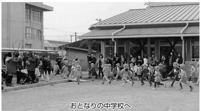
おとなりの中学校へ