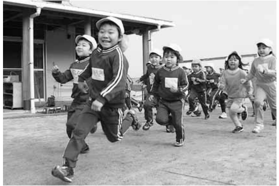
ボクがトップだよー (園庭1周)

心地よい汗を流したあとは お楽しみの鏡開き、おいしい ぜんざいに舌鼓み。嘉島幼稚 園のマラソン大会でした。