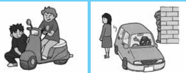
不審者・不審車両を見かけたら、すぐに110番を！