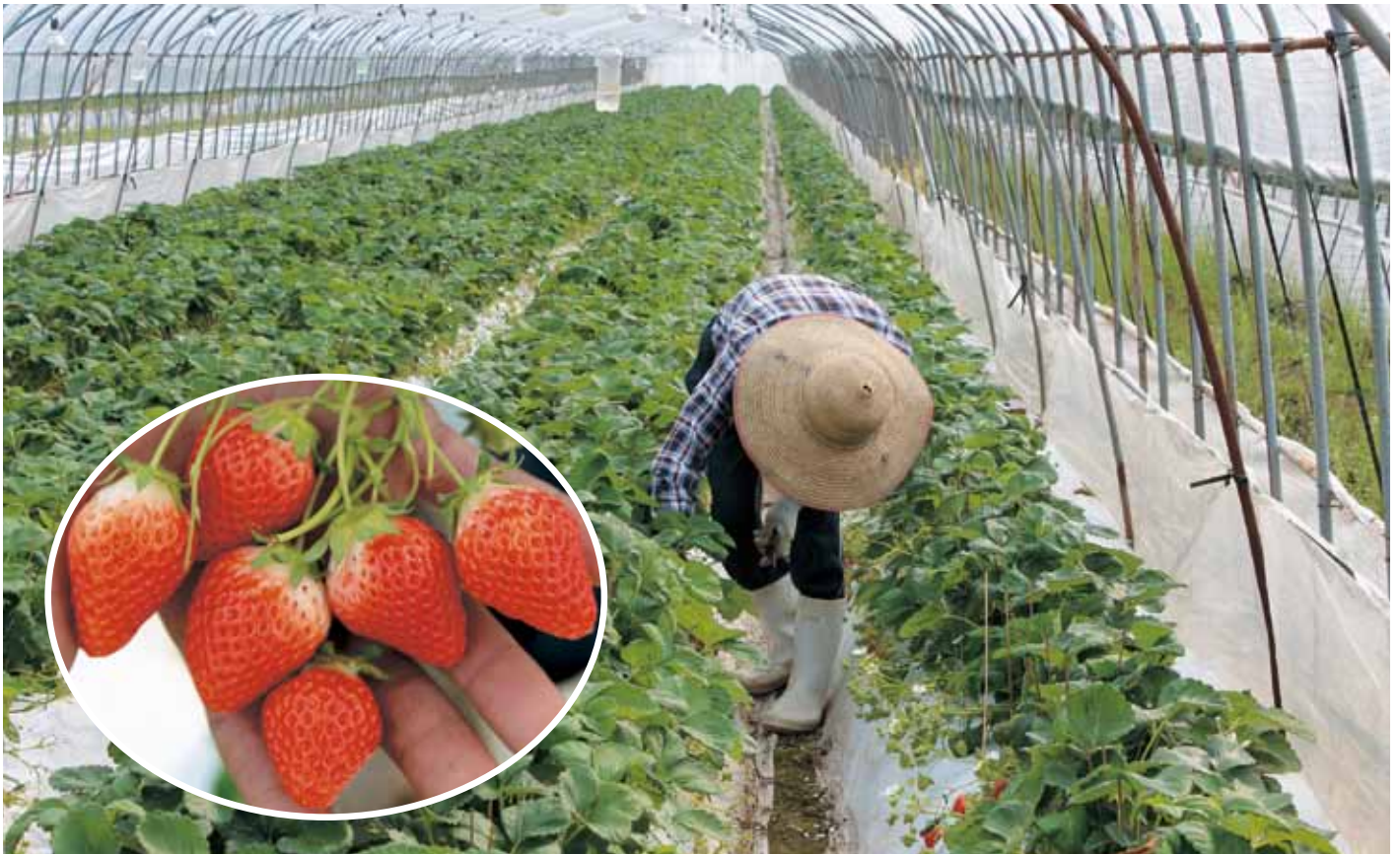
(北甘木のイチゴ農家)