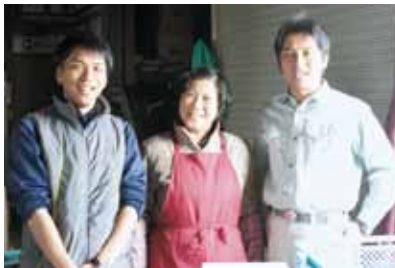
左から弟・母・本人

嘉島町の町づくりの基本である「清水湧き、心ふれあう嘉島町」を理念に、土地・環境・気候風土に恵まれた最高の嘉島町を再確認していただき、町民一人ひとりが、より暮らしやすい町づくりの充実を心から願っております。