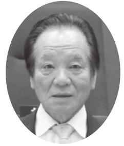
河原 泉 議員