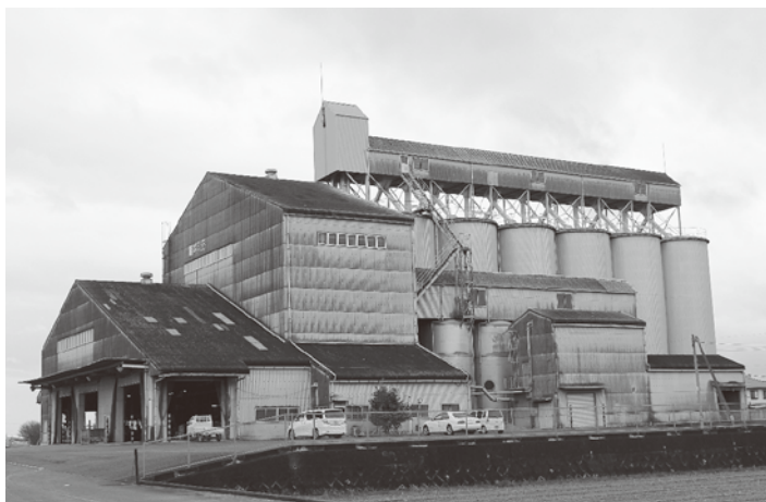
大島カントリーエレベーター施設

町の主産業は農業である。強い農業を目指し、農業の衰退だけは免れなければならぬと思えます。今後とも、指導、支援よろしくお願ひします。