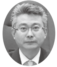
宮本 睦生 議員