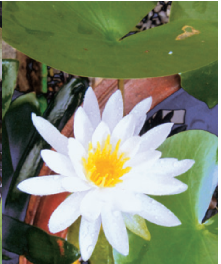
紅白のスイレン 花言葉：「清純な心」「優しさ」など