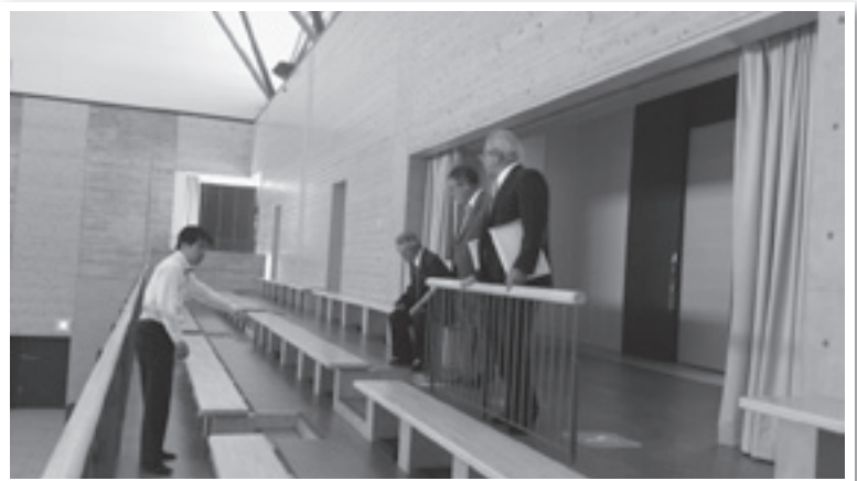
長泉町 ウェルピアながいずみ 健康増進センター

長泉町では、平均年齢が若い町であるが高齢化は確実に進んでおり、町民の疾病による国民健康保険特別会計の支出も年々増加している。そこで、「健康都市宣言」を行い、「住民ひとり1人が生涯を通じて健康な心と身体を育て、元気に暮らせるまちづくり」に取り組まれている。