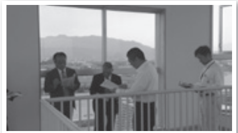
昭和町 常永小学校 展望所