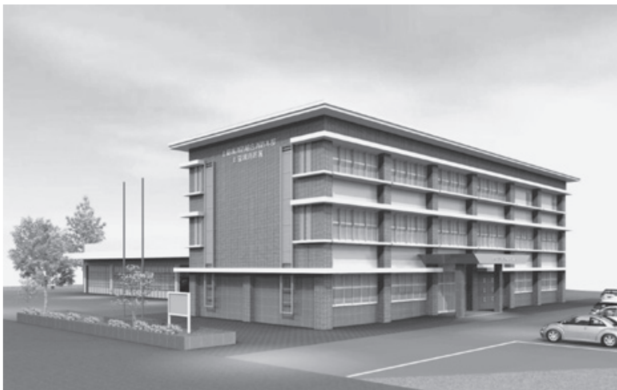
上益城消防組合消防本部・上益城消防署 新庁舎完成予想図