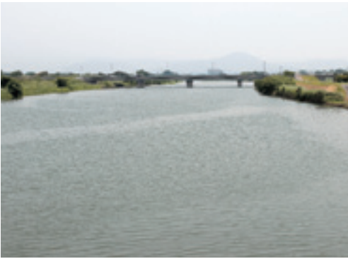
河川改修された加勢川（犬淵大橋付近）

人に大切な物の一つとして嘉島の「川」「水」これらをより良い状態で子孫孫まで残してやる事が現在私達の責務ではないでしょうか。