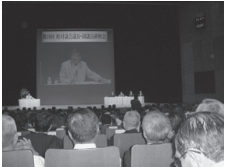
東京メルパルクホール

それぞれの町村議会において、住民に開かれた議会を目指す取り組みを実施するなど、分権時代に対応した活性化方策を積極的に展開されていることに刺激を受け勉強になった。