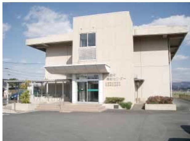
連合事務局が入る嘉島町福祉センター (嘉島町上島)