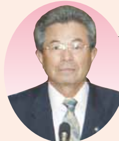
5 岡 牧生 議員

③町内の地域格差ができないように、町民の皆さん方との会話を大切にして、意見、要望などが行政に反映できるように努め、住みよい町づくりに努力をいたします。