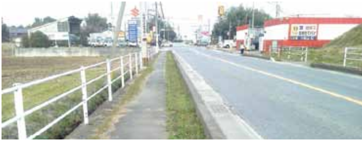
六嘉秋津新町線歩道

答 以前上益城地域振興局により歩道整備を計画されましたが、用地の問題により実行できない状況です。今後、県へ要望していきたい。