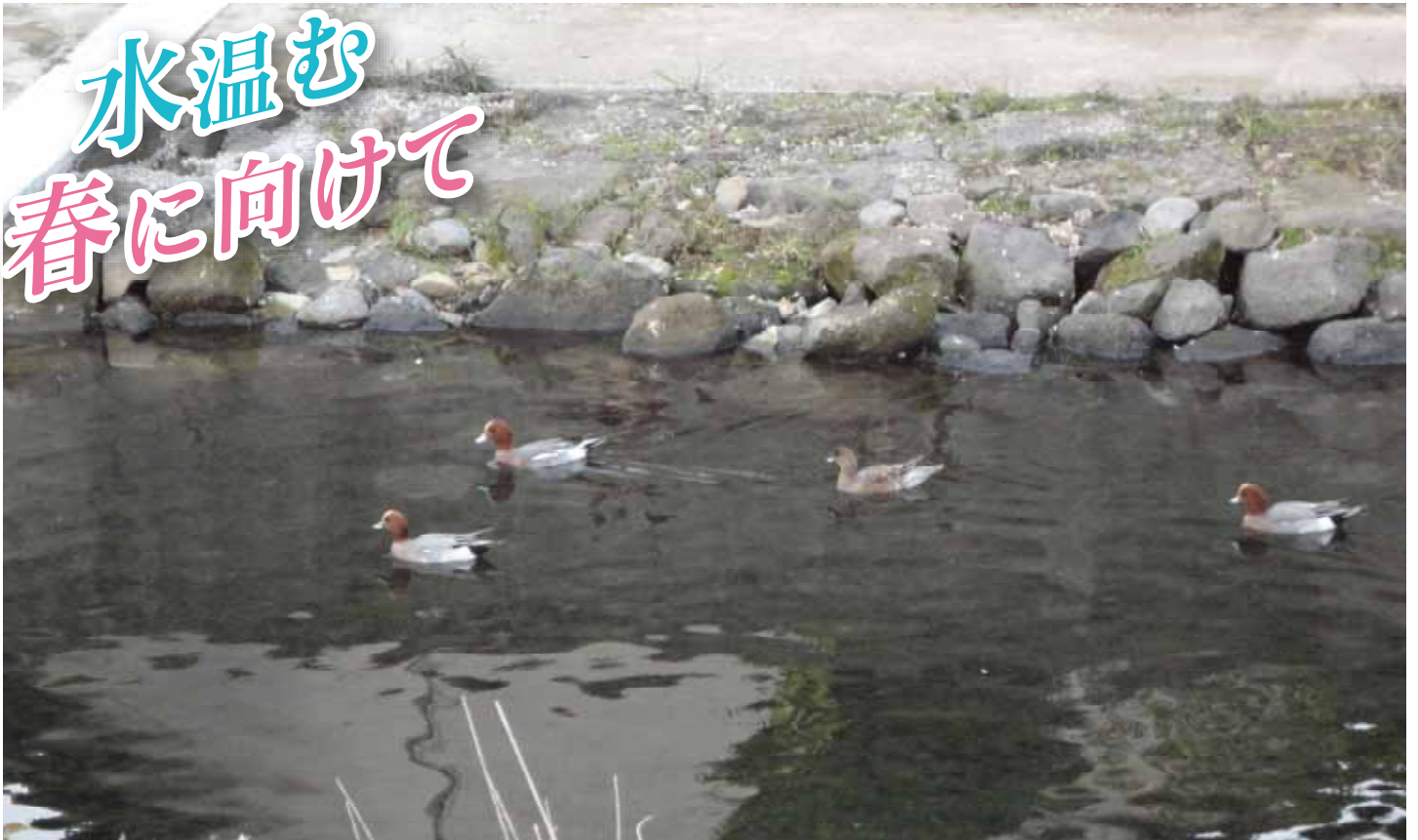
下六嘉橋下流(矢形川 旧河川)