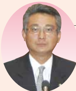
11 宮本 睦生 議員