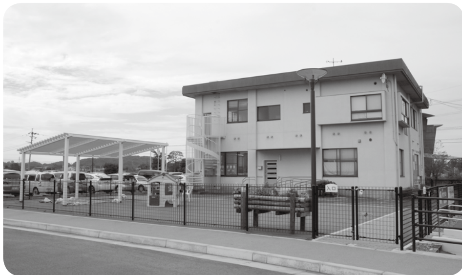
平成27年4月に開所した子育て支援センター