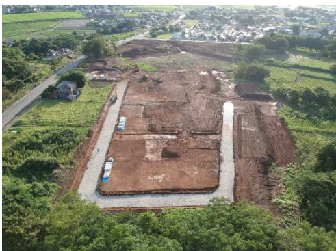
1-1 工区(南)で造成工事が開始