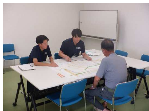
2工区・1-1 工区(北)の個別説明会を実施