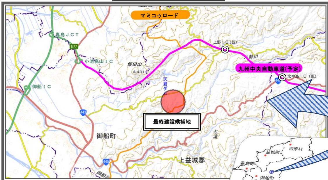
最終建設候補地位置概略図

なお、目標では新たなごみ処理施設の稼働時期を平成37年度としていますが、熊本地震や、その後の大雨等の自然災害によって各町村の財政状況は想定以上に厳しくなっているため、建設工事への着手時期については、各町村の財政状況を勘案しながら検討してまいります。（6月7日 現在）