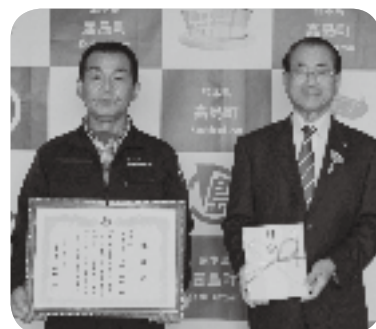
鍋田町長と宮崎勝信代表 取締役