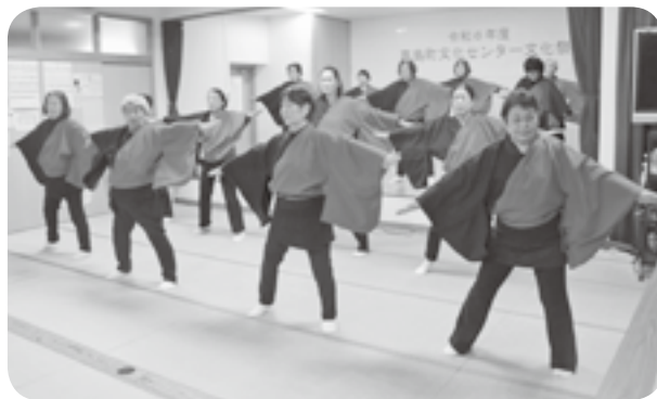
レクリエーションダンスを披露する嘉島町文化センターの講座受講者

会場には書道、手芸教室生の作品や、小中学生の人権作品を展示。西村のサロンリーダーや老人会員が作った煮込みうどんやおにぎりが振る舞われました。