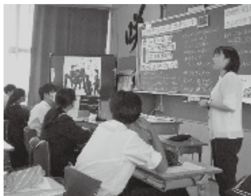
【3年生人権学習（授業）のようす】

部落差別による就職差別事象が明らかになったことで、「統一応募用紙」が作成され、採用選考時の面接における違反質問についても、「言わない、書かない」取り組みが始まりました。『43の項目の質問状』（出典：きずな）を通して、適性や能力以外で採用選考することが許されないことに気づき、仲間のために差別をなくす行動ができるようになるためにはどうすればよいかを考えました。また、仲間のために行動するためには、お互いを知ることが大事だと気づき、学級内で自分を語る取り組みも行いました。