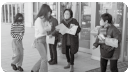
チラシを配布する町民生委員児童委員

土日祝日の閉庁日も日直の職員が受け取ります。役場に来ることができない方は、郵送やメールなどでも受け付けます。