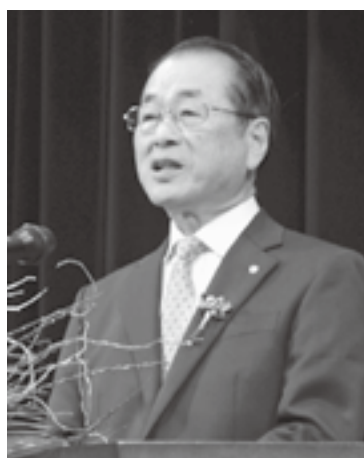
式辞を述べる 鍋田町長