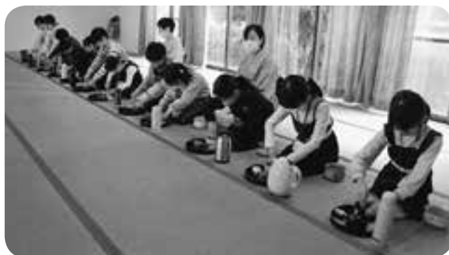
お点前を披露する嘉島町親子茶道教室の子どもたち