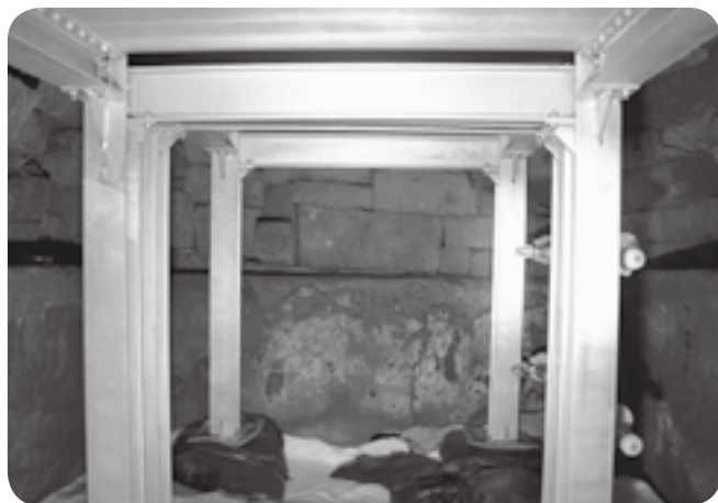
安全確保のための鉄骨製の装置が設置された井寺古墳の内部