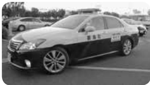
街頭パトロールに出発する 嘉島町の青パト

と吹奏楽部による公演がありました。この後、パトカー8台と青色防犯パトロール車（青パト）7台が、街頭パトロールに出発しました。