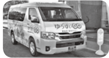
町乗合タクシー「ゆうすいGO」

嘉島町地域公共交通会議が12月19日、役場であり、町乗合タクシー「ゆうすいGO」の利用登録者へのアンケート（令和6年3月実施）の結果を報告。結果に基づき対策案が審議され、往路・復路とも3月1日から1便増便することを決めました。