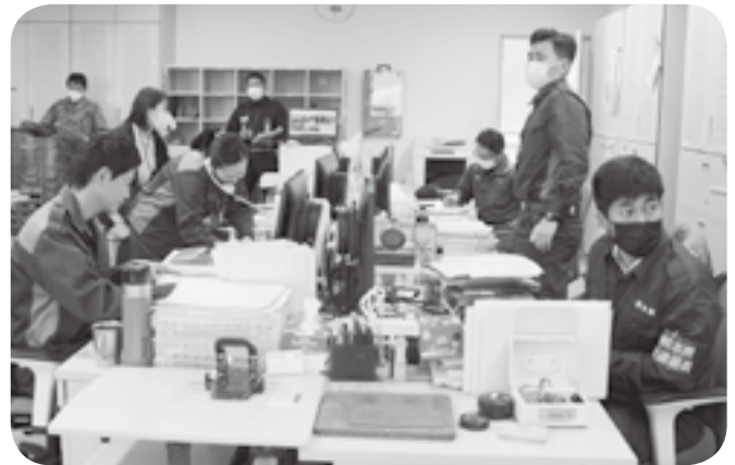
豪雨を想定した対応訓練に取り組む役場職員ら

「加勢川が氾濫して住宅が浸水した」「住民が屋根の上に逃げた」「走行していた車が流された」などの情報が次々と入りました。町は緊急安全確保情報を発表し、住民に自らの命を守る行動を呼び掛けました。また自衛隊ヘリの出動を要請。しかし、ヘリ発着場が浸水し、別の場所を探す緊迫した場面も。職員たちは真剣な表情で訓練に取り組んでいました。