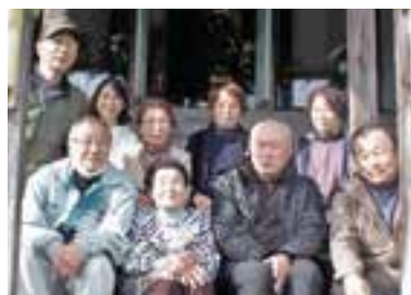
①は釈迦の涅槃像の掛け軸。②は西光寺集落の住民たち

てきました。金色など鮮やかな色が保たれています。昨年、町文化財センターに寄託しました。釈迦の命日のこの日だけ薬師堂に飾ります。来訪者には、お茶と饅頭が振る舞われました。釈迦が生まれた4月8日は釈迦像に甘茶をかけて祝います。