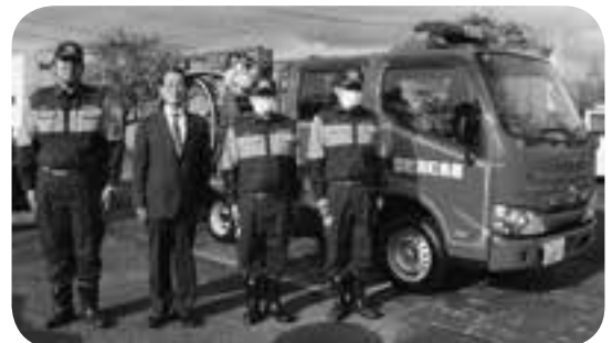
配備された小型動力ポンプ積載車の前に鍋田町長と並んで立つ三郎無田の消防団員