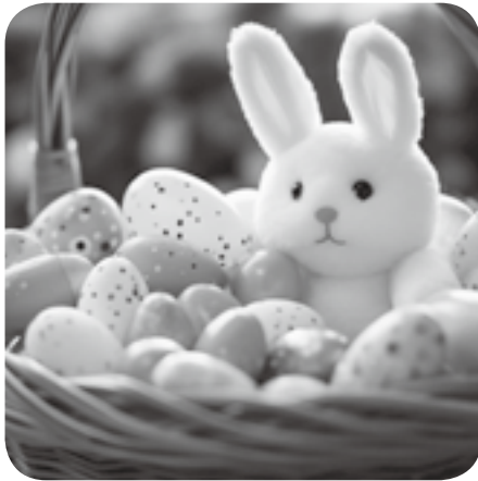
イースターエッグ