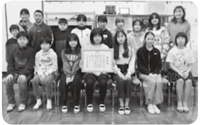
嘉島西小のボランティア委員会のメンバー