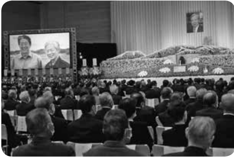
700人が参列して執り行われた荒木前町長を偲ぶ会の式典

嘉島町長を10期37年務め、昨年10月に77歳で死去した荒木泰臣前町長を追悼する「故荒木泰臣氏『偲ぶ会』」が2月25日、益城町のグランメッセ熊本で行われ、嘉島町民ら1250人が最後のお別れをしました。