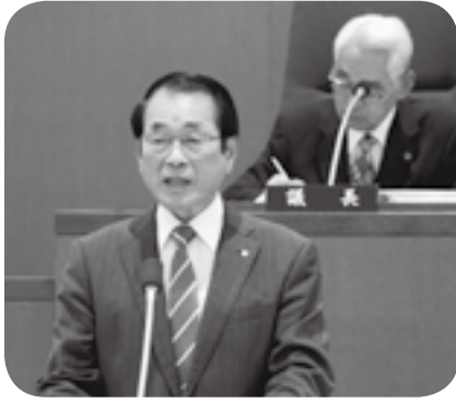
町政報告をする鍋田町長

◇令和6年度予算 一般会計総額は本年度を約20億円上回り約30%増。歳出では学校教育環境の整備に加え、行政