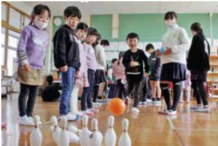
嘉島東小で、5年生が準備したボウリングゲームで遊ぶ新1年生

東小では2月9日、入学予定の63人を、5年生が4班に分かれ校内を案内。各教室の黒板には歓迎する言葉や絵を描いて出迎えました。輪投げやボウリングゲーム、フルーツバスケットなどで遊び、新1年生は楽しそうに歓声を上げていました。