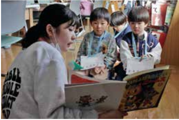
嘉島西小で、5年生による絵本の読み聞かせを楽しむ新1年生

西小では2月6日、入学予定の88人が11班に分かれ、今春最上級生となる5年生に手を引かれて校内を巡りました。図書室では5年生が絵本