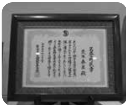
会場に飾られた「名誉町民章」