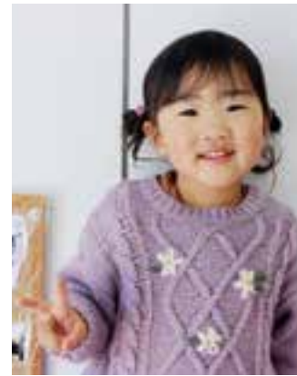
笑顔ですくすく育ててね!