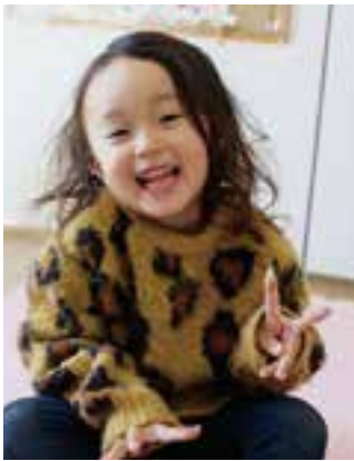
元気いっぱい!!笑顔いっぱい!!