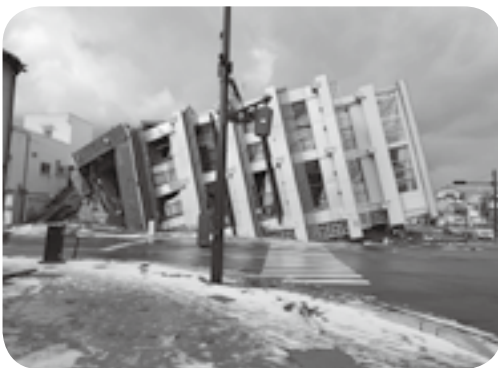
能登半島地震で倒壊した輪島市のマンション

いぜん道路状況が悪く、宿泊地から調査現場までバスで2時間半～3時間かかり、朝6時に出発しています。派遣された職員たちは「熊本地震よりも被害が大きく、復旧には時間がかかりそう」などと話しています。