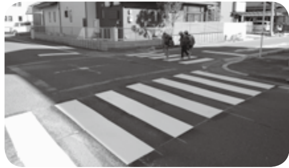
上島の中津交差点（通称）にL字型に設置された横断歩道