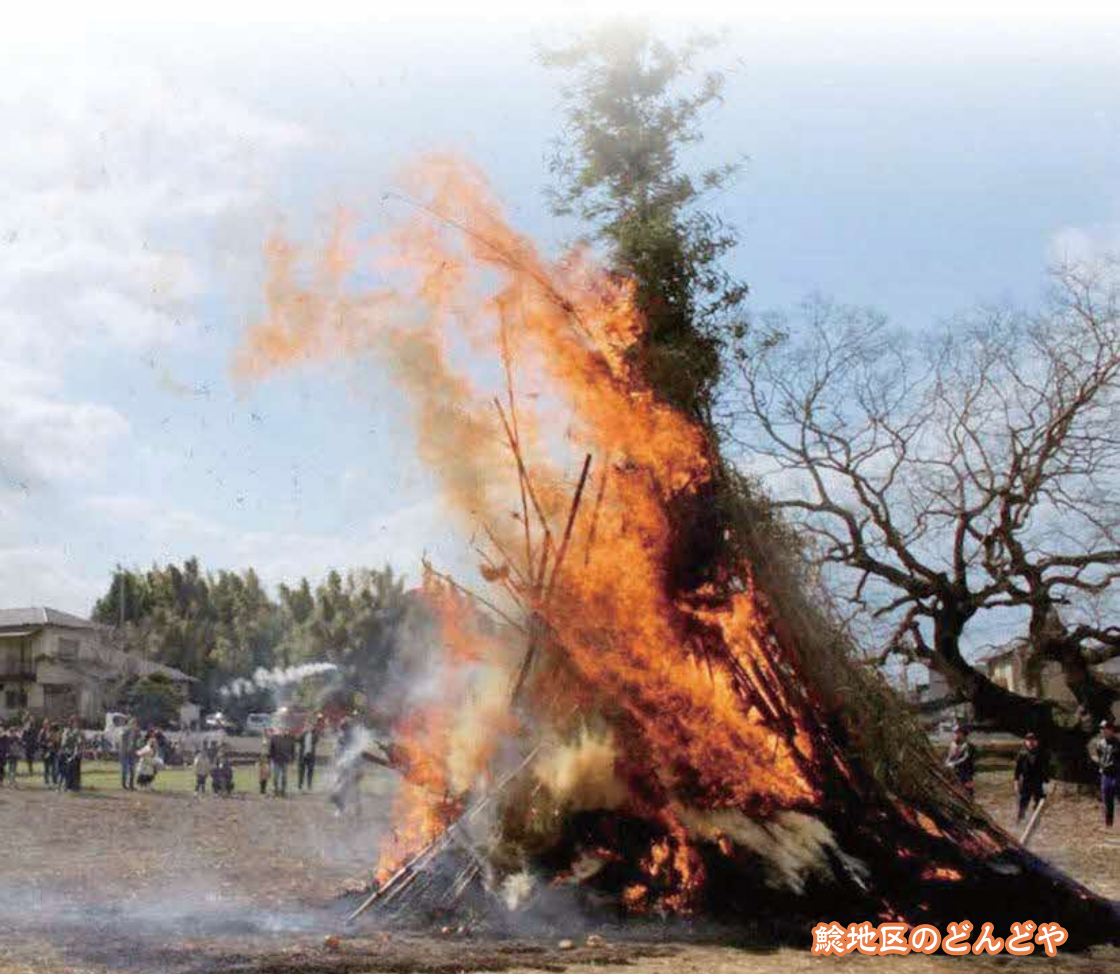
鯨地区のどんどや