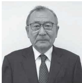
園田 義宣 議員(71歳) 所属：経済厚生常任委員会

私は、町民の皆様の見解や、願いのすべてを代表するものとして住民と町政の橋渡し役に徹し、正しいことは勇気をもって取組みます。町の仕事に町民の意見を反映させるよう話し合う議会を目指します。