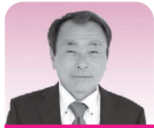
森下 文夫 議員