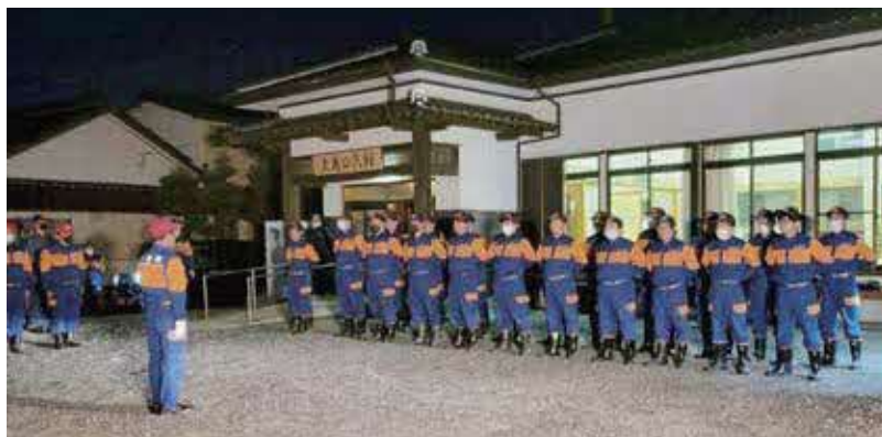
去る12月28日嘉島町消防団による年末警戒実施 (写真は、第3分団第1部 上島)

議会事務局に写真を持参いただくか、メールの場合は、写真を添付し氏名、コメントを入力のうえ gikai@town.kashima.kumamoto.jpまで送信してください。