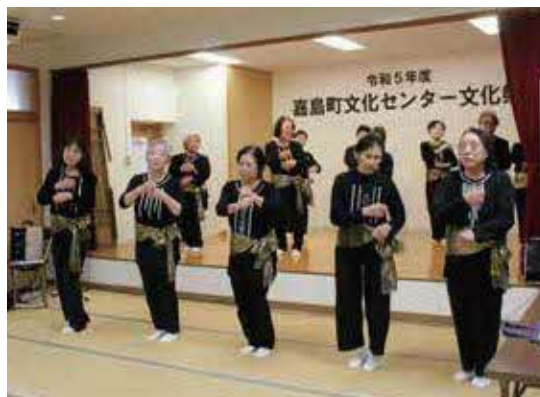
嘉島町文化センター文化祭で レクリエーションダンスを披露する 受講生の方々 (1月13日)