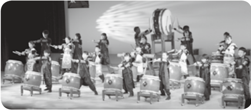
かしま太鼓保存会の「湧嘉島」の演奏

「かしま太鼓創設25周年記念大会」と題した、かしま太鼓保存会の演奏会が11月26日、町民会館ホールで行われました。36人のメンバーが、勇壮で息の