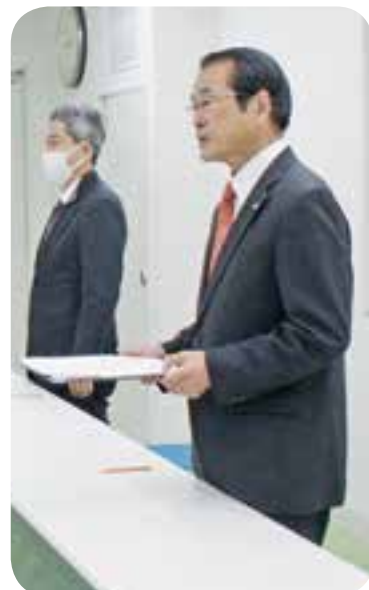
月初めの庁内常会で、集まった役場職員に語りかける鍋田町長

町長選では「町民に開かれた町政」を公約しましたが、早速その具体化に取り組んでいます。一つ目が役場の「総合案内所」の設置です。役場にきた人が、どの課に相談すればいいかを案内する窓口です。玄関から入って左側の町民保険課カウンターに設置する準備を進めています。町民の皆さまの声をしっかり聴き、町政に反映するため、ご意見を書いて入れてもらう「投書箱」も早急に役場に設置します。ご意見をお待ちしています。