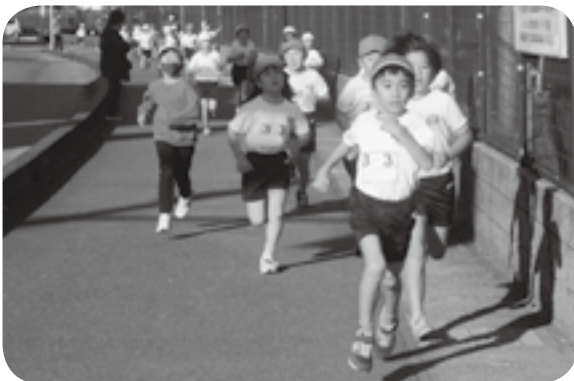
持久走大会で嘉島西小の外周道路を走る3年生

嘉島西小で12月2日、恒例の持久走大会があり、児童たちが運動場と、学校の外周道路を周回するコースを走りました。