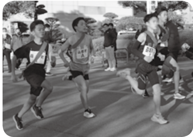
①嘉島町の駅伝代表メンバーら ②一斉に駆けだす1区の選手たち