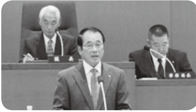
町議会第4回定例会

嘉島町議会の本年第4回定例会が12月5日、3日間の日程で開会、追加提案された人事案を含む23議案（専決処分2、条例12、議決事件1、補正予算6、人事1、その他1）をいずれも原案通り可決、