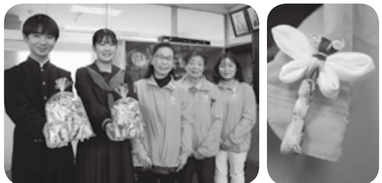
町商工会女性部から贈られた「合格トンボ」を手にする嘉島中生の2人。写真⑥は「合格トンボ」のアップ