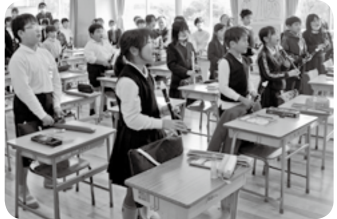
嘉島町特産の大豆をテーマに自ら作詞した「大豆のうた」を合唱する児童たち