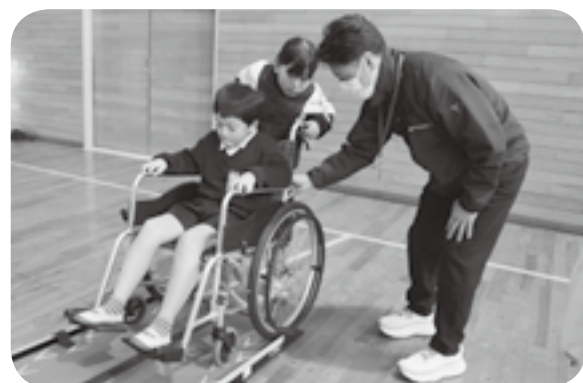
スロープで車いすを押す児童