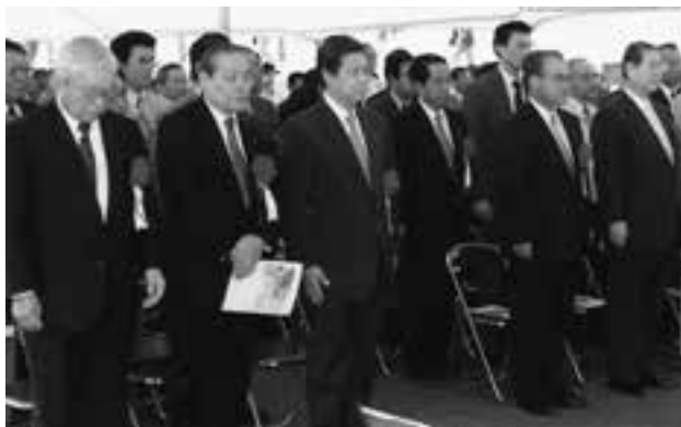
加勢川の第六閘堰（熊本市）の竣工式に出席