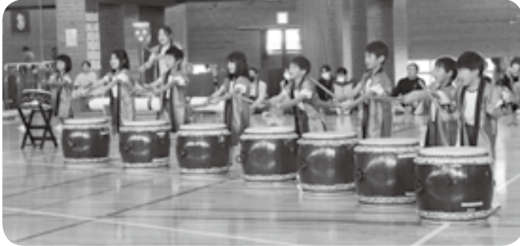
さくら太鼓（かしま幼稚園）