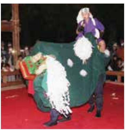
獅子の背中に乗る「棒使い」