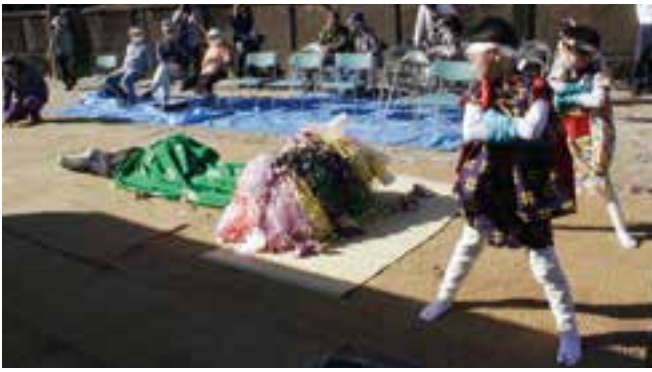
写真上は、荒々しい獅子を操る「棒使い」、下は、「棒使い」が獅子を眠らせる場面