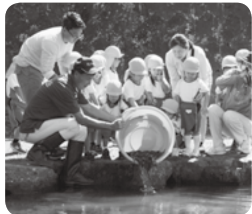
ウナギの稚魚を放流する かしま幼稚園の園児

「大きくなってね」 園児がウナギ放流 嘉島町下六嘉の旧矢形川（六嘉橋の下）で10月6日、かしま幼稚園の年少児20人がウナギの稚魚を放流しました。 緑川漁協が漁業資源保全のため、町と連携して放流事業を行います。 用意されたのは20〜25センチに育った稚魚約800匹（総重量約20キロ）。園児たちはウナギを入れた大きなバケツに手を入れて、ぬるぬるした感触を体感しました。この後、小さなバケツで川に放ち、「大きくなってね」と声をかけていました。