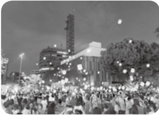
国際交流祭典の一場面