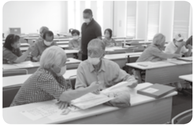
脳いきいき教室で、2人1組で言葉を交わす参加者ら