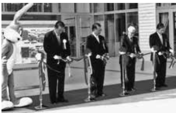
「ダイヤモンドシティ・クレア」（現イオンモール熊本）オープン祝いテープカット

1987 年 1 月 無投票で嘉島町長に初当選。 「東部台地開発、加勢川改修事業、区画整理事業などを促進したい。豊かな水と緑を生かし、地域をおこしていきたい」