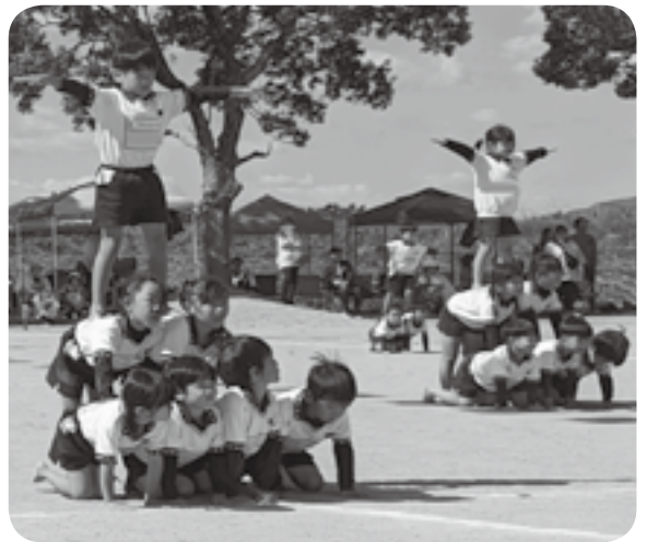
ピラミッド（おひさまリリー保育園）