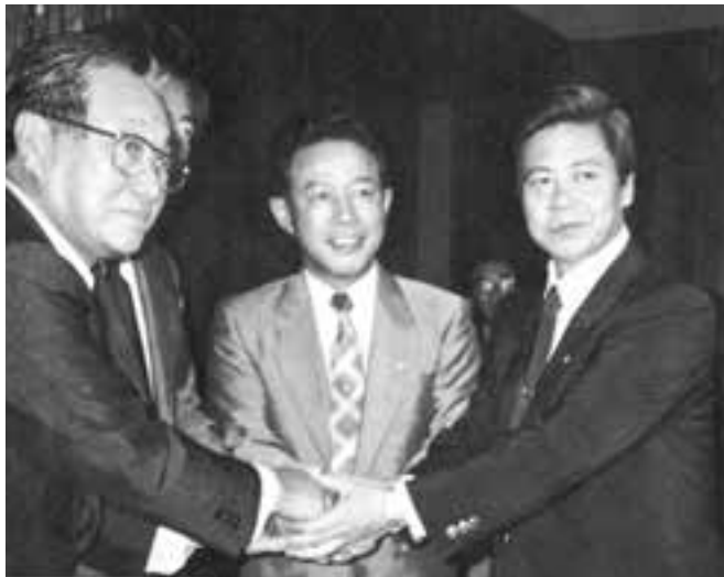
サントリーのビール工場進出協定に調印