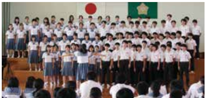
郡中学音楽会への出場推選を受けた 3年1組の合唱（上）と3年生の学年合唱