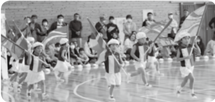
カラーガード（東部幼光保育園）