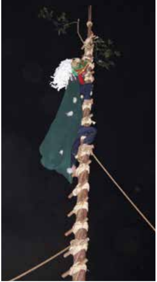
高さ20メートルの「登り竿」に登った獅子