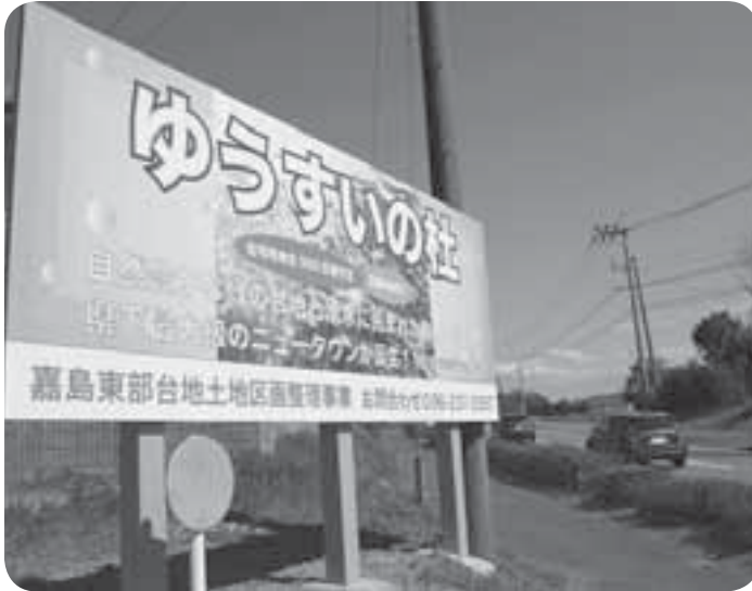
開発予定地の北甘木地区に立てられた「ゆうすいの杜」の広報看板