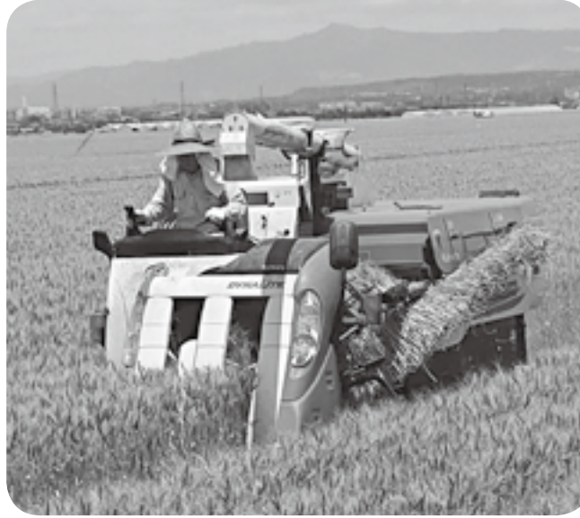
↑ コンバインで小麦を収穫する農家。写真④は刈り取った小麦