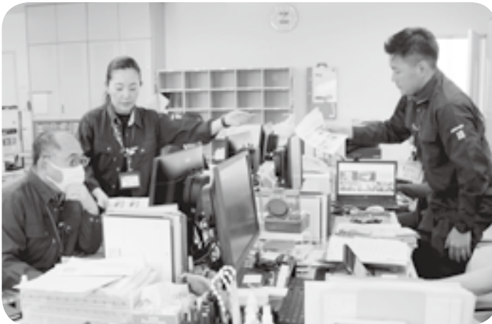
本番さながらの真剣な表情で訓練に臨む町職員

緑川と加勢川の堤防を越水した情報が入ると、過去に経験したことがない事態に緊張が一気に強まりました。緊急安全確保情報を発表し、自らの命を守る最善の行動を呼び掛けるなど、職員らは終始真剣な表情で訓練に取り組んでいました。