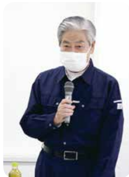
嘉島町災害対策会議及び水防協議会 で 本部長としてあいさつする荒木町長

梅雨入り後、7月3日には大雨となりまし たが、大きな被害も出ず、ほっとしています。 梅雨が明けると台風シーズンが訪れます。大 雨による災害に、引き続き警戒しなければな りません。