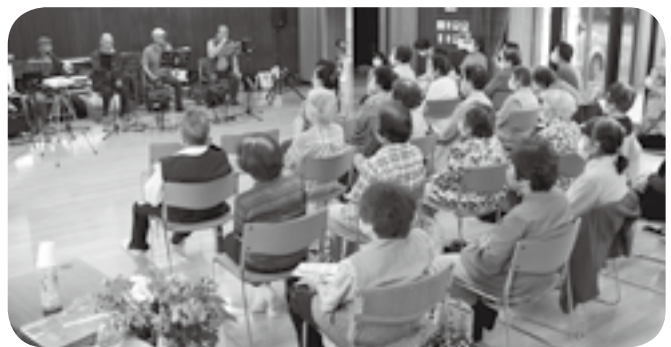
101回目のサロンで童謡コンサートを楽しむ参加者