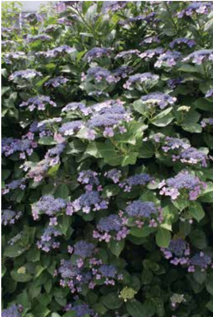
「嘉島リバゾン」の敷地北側に立ち並ぶアジサイ