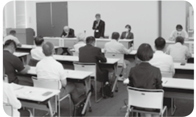
町人権教育推進協議会の総会