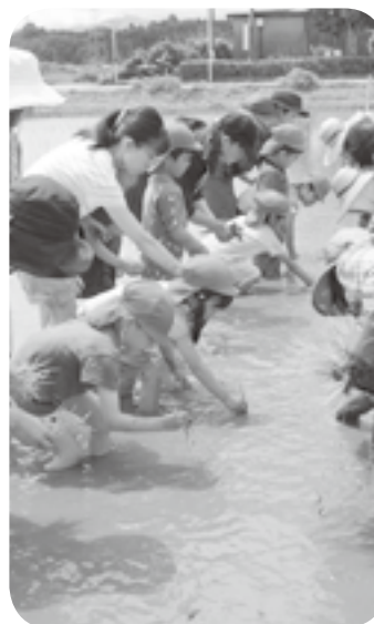
↑ 町農村女性グループのメンバーの手ほどきを受け、水田にもち米の苗を植える園児