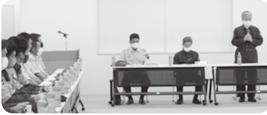
役場で開かれた町災害対策会議・水防協議会