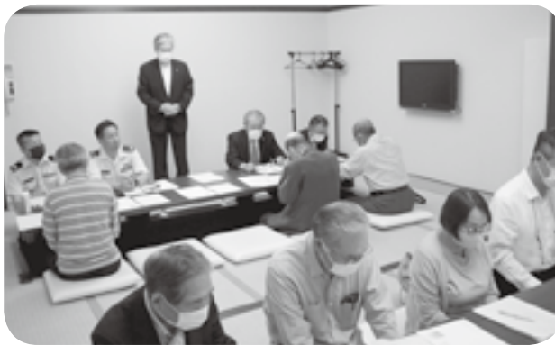
町自衛隊家族会の総会

嘉島町自衛隊家族会の総会が6月9日、嘉島湯元水春で会員ら約20人が出席して開かれました。