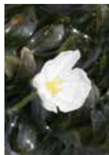
役場西側の水路で一斉に白い花を付けたオオカナダモ。右上は花のアップ