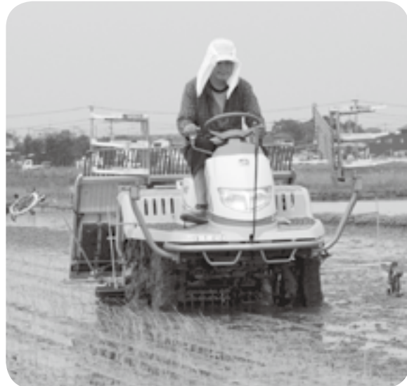
↑ 水を張った田にコメの苗を植え付けていく農家

食育は、生きる上で基礎となるもので様々な経験を通じて「食」に関する知識と、バランスの良い「食」を選択する力を身に付け、健全な食生活を実践できる力を育むことです。大人になってからも食育は重要です。健康的な食のあり方を考えるとともに、だれかと一緒に食事や料理をしたり、農作物の収穫を体験したり、季節や地域の料理を味わうなど、食育を意識して生活してみませんか。