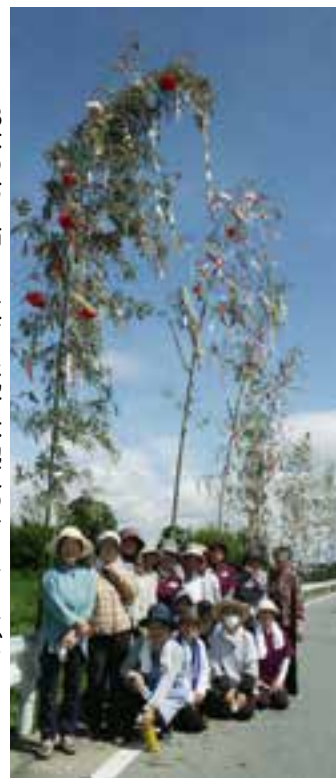
13本の七夕飾りを立てた北甘木地区のサロンメンバー

北甘木地区の矢形川右岸に7月2日、13本の七夕飾りが立てられました。北甘木のサロンメンバーと親子会が行いました。