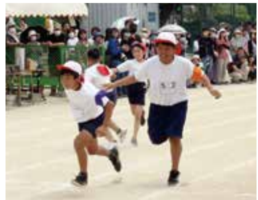
あとは任せて！（東小）