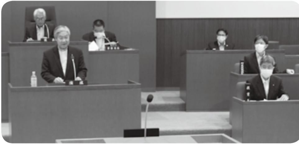
嘉島町議会の令和5年第2回定例会