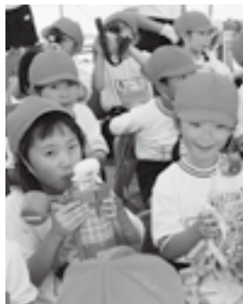
水分補給ばっちり