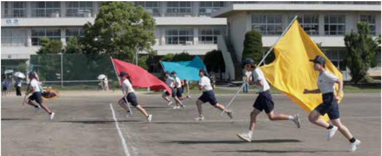
団旗はためかせ疾走（嘉島中）