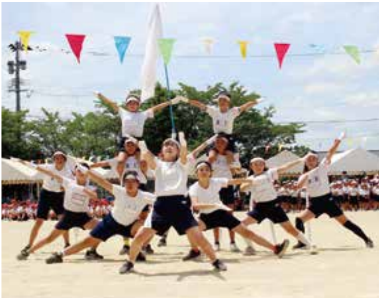
▲応援演舞一糸乱れず（東小）