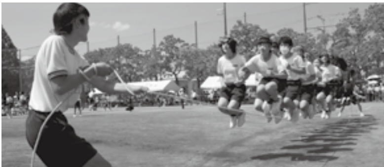
息そろえジャンプ