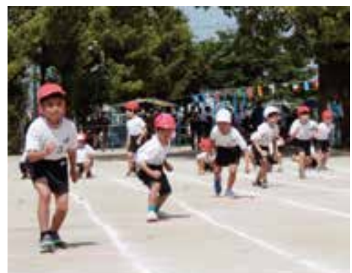
位置について、よいい（西小）