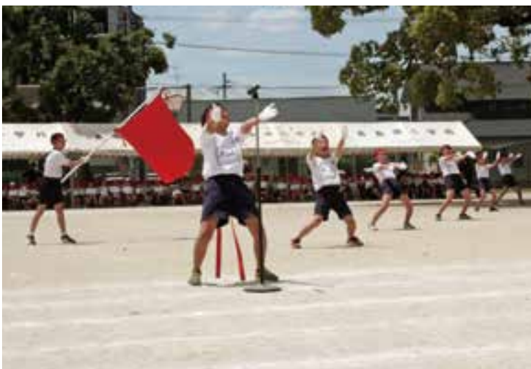
フレー、フレー（西小）