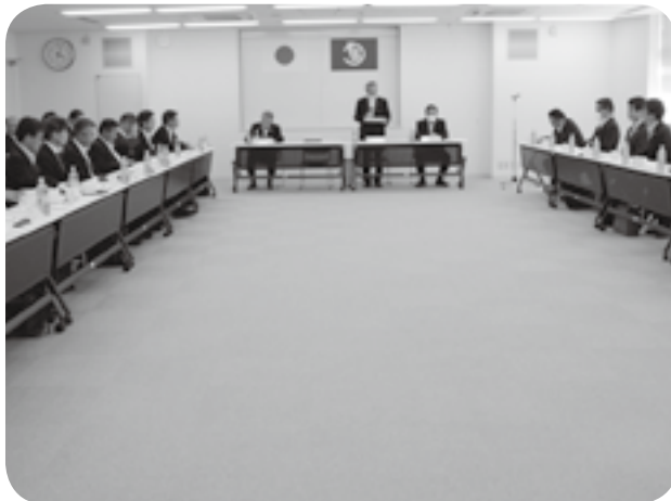
嘉島町役場で開かれた緑川改修期成会の総会

る堤防の崩壊を防ぐ訓練を展開。てきぱきとした動きを見せていました。ほかの自治体の水防団も土の積み、木流し工法などの演習を繰り返しました。緑川