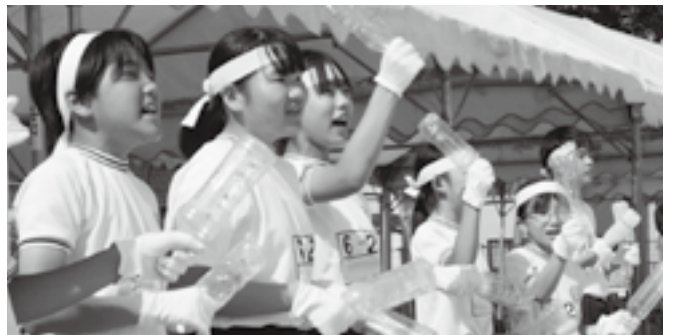
応援も負けられない!