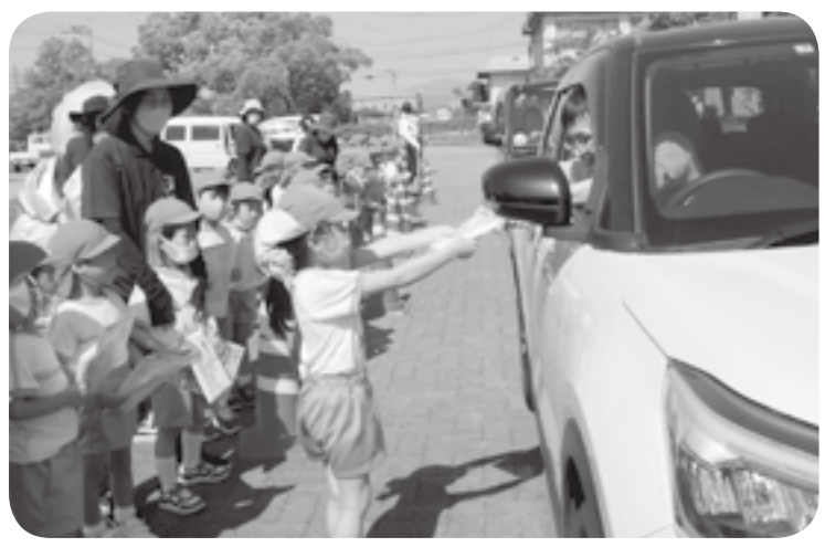
ドライバーに安全運転をお願いする嘉島保育園の園児たち