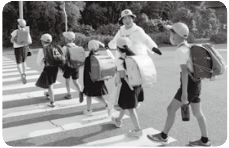
街頭に立ち、登校する児童らを見守る町交通安全母の会のメンバー