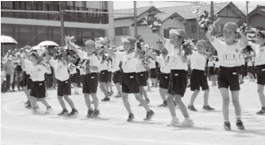
▲ いっぱい練習したよ