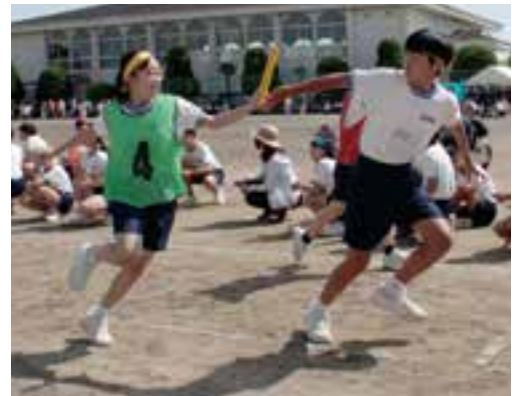
バトンつなぐ（嘉島中）