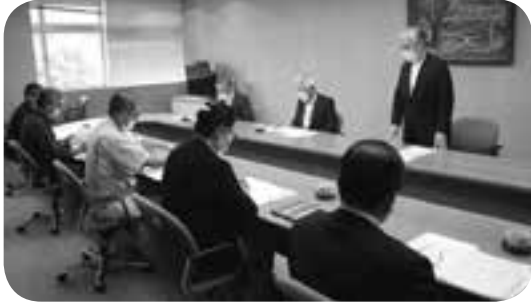
「かしま水の郷まつり」の実行委員会であいさつ