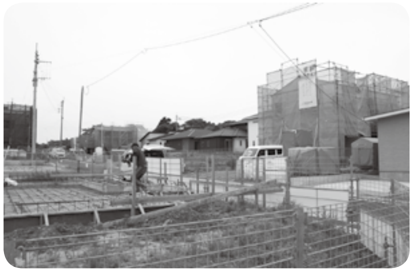
住宅が次々に建ち始めている「ゆうすいの杜」の一角

東部台地で宅地開発が進んでいる「ゆうすいの杜」に新たに住宅が着々と建ち始め、現地では槌音が響いています。「ゆうすいの杜」は、井寺と北甘木にまたがる約70畝の土地区画整理事業です。住宅地や商業用地として開発し、将来的に保留地（分譲地）900区画を整備。民有地500区画を含めると、全体では1400区画に上る、県内屈指の規模の住宅地ができます。