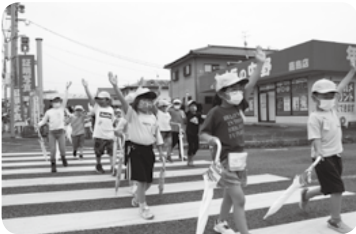
手を挙げて横断歩道を渡る嘉島西小の1年生たち

第1期に住宅メーカーの分譲地として販売した34区画のうち5月末までに26区画で着工。このほか民有地でも10区画で住宅建設が進み、5月末までには合わせて10戸の住宅に住民が住み始めています。第2期の分譲地販売については、宅地造成に先立って基盤整備が必要なため、売り出しまで数年を要すると見込まれています。