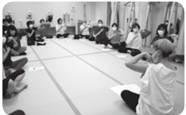
講師の説明を受け肩のストレッチをする受講生ら