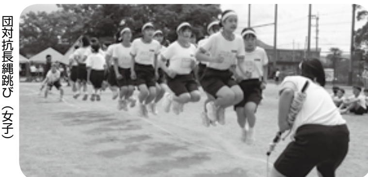
団対抗長縄跳び(女子)