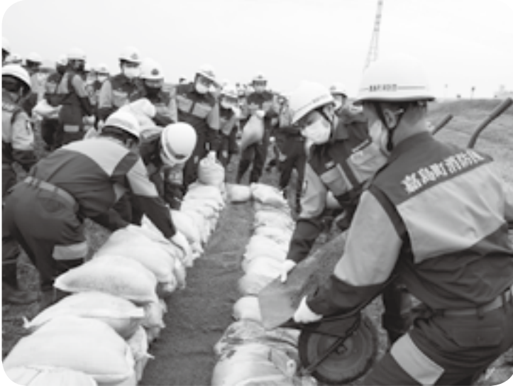
土のう積み工法に当たる嘉島町水防団

緑川水防演習が5月15日、嘉島町犬渕の緑川河川敷で開かれ、嘉島町を含む流域7団体で編成された水防団など合わせて148人が参加して、堤防決壊などへの対応訓練を展開しました。 梅雨や台風シーズンに備えて流域自治体持ち回りで実施。コロナの影響を受け、流域そろっての実施は3年ぶりでした。