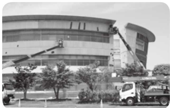
高所作業車を使って行われた役場庁舎の外壁塗装工事