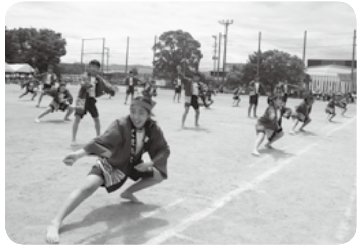
よさこいソーラン