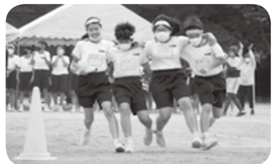
四位一体で駆け抜ける!!