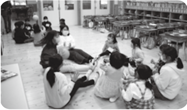
5年生とボールを使ったゲームを楽しむ“新1年生”たち = 嘉島西小