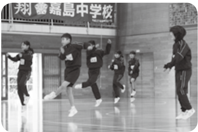
軽快で素早い動きのダンスを披露する嘉島中の1年生たち

嘉島東小の持久走大会が1月31日に開かれ、児童たちが次々に校門を飛び出し、沿道の声援に応えるように元気に駆け抜けました。 毎年恒例の冬の行事。運動場をスタート・ゴールに学校の周辺の道を走る1・2年生1キ、3・4年生2キ、5・6年生3キのコースです。児童たちは業間20分の「ランラントタイム」を使って練習を重ねてきました。 1年生から時間をずらしながら順にスタート。児童たちは、沿道に陣取った家族や地域住民から「頑張れ」の声援を受けて力走Ⅱ写真。それぞれ自己ベストを目指し、懸命の表情でゴールしました。