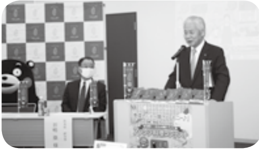
アレンジ料理コンテスト表彰式であいさつ