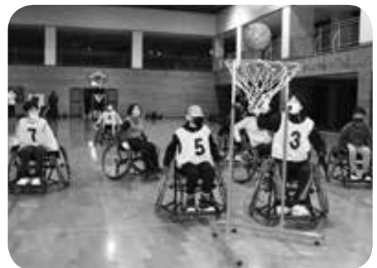
車いすバスケットを楽しむ参加者たち

「だれでも、だれとでも、いつまでも」をモットーに各種スポーツに取り組み嘉島町総合地域クラブ「嘉島湧く湧く元気クラブ」では1月26日、嘉島町民体育館で車いすバスケットの体験会を開きました。