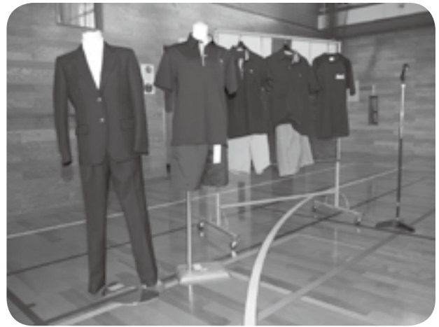
新たに冬用の制服に加わったブレザーとズボン（左端）と、ポロシャツに短パンの夏服（左から2番目、3番目など）