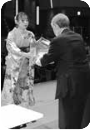
町二十歳を祝ついで記念品を贈呈