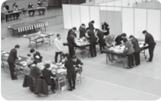
定数11を立候補者13人で争った町議選の開票作業 115日、町民体育館