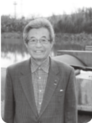
高田堰掛土地改良区理事長

このコンクールは、県と県内農業団体、熊日の主催。県内の農業と農村の振興を図るため、優れた農業経営、地域農業を支える活動などが毎年顕彰されています。