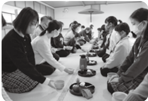
学んだお点前を保護者に披露する子どもたち（右側）