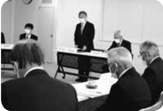
町地域公共交通会議であいさつ