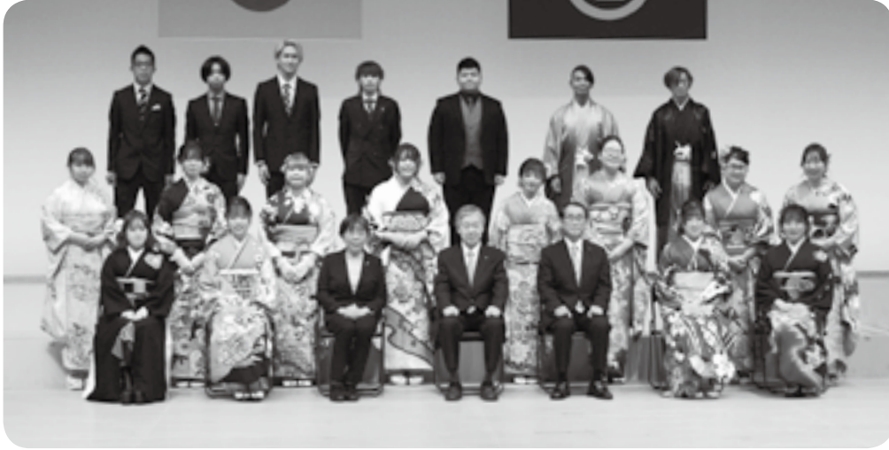
町二十歳を祝う会 記念撮影