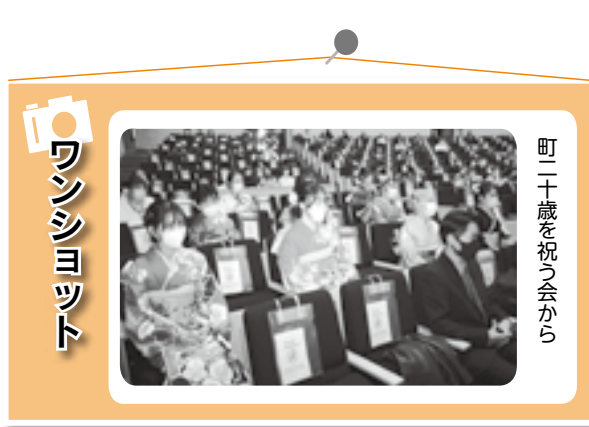
町二十歳を祝う会から