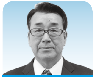
川野 伸一 議員