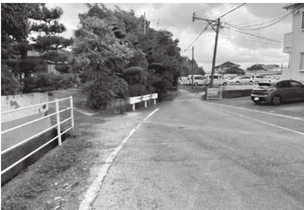
都市計画道路鯉森崎橋線起点付近

鯉森崎橋線については、昭和56年12月(18日)に都市計画が決定され都市計画道路の90mが整備をされている状況です。