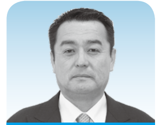
春日 堅一 議員

新しい時代の教育に向けた持続可能な学校指導・運営体制の構築のための学校における働き方改革に関する総合的な方策の一つとして、学校給食費の徴収・管理業務を地方自治体が自らの業務として行うことを文部科学省が令和元年に都道府県教育委員会等に通知したものです。公会計化により、教員の業務負担軽減と保護者の利便性の向上などの効果が見込まれるとしています。