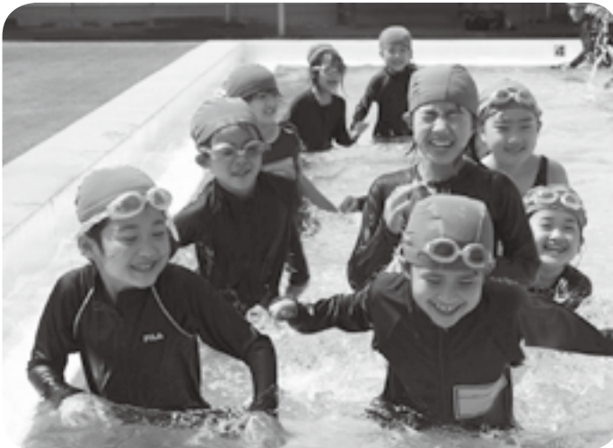
プールの縁に沿ってみんなで歩き水泳授業を楽しむ子供たち

準備運動の後、低学年用のプールに入り、みんなでプールの縁に沿って歩いて即席の「流水プール」にしたり、先生が手に持った輪っかをくぐり抜けたりして楽しみました。また底に沈めた球や棒を拾い上げる「宝探し」も楽しんでいました。