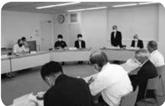
町地域公共交通会議であいさつ