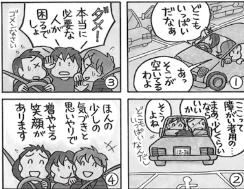
(漫画：桜田幸子さん)