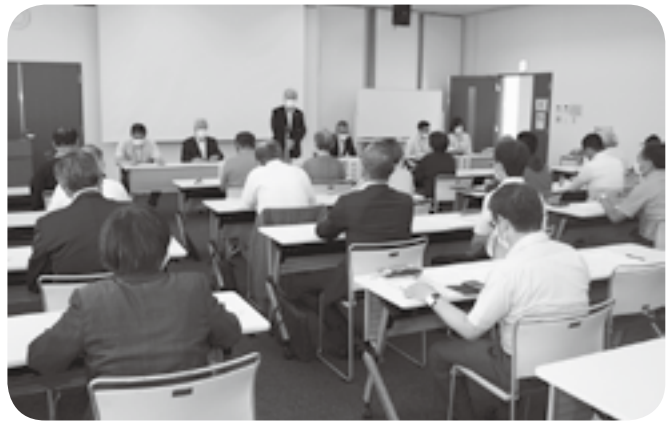
町人権教育推進協議会の会場