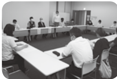
PTA防犯パトロール隊の総会

総会では、8月6日の「かしま水の郷まつり」で巡回活動を行うことを申し合わせ。原則、毎月第3金曜の夜、イオンモール内外の巡回と青パトによる校区内見回りを行います。