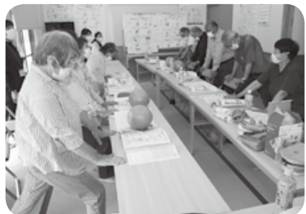
ストレッチ運動に精を出す三郎無田サロンのメンバーら

町社会福祉協議会が支援している住民主体のふれあいいきいきサロン活動が三郎無田で初めて開かれ、町内全地区で取り組まれるようになりました。