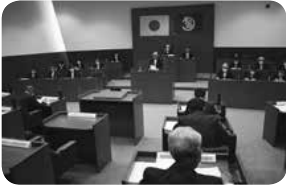
町議会第2回定例会