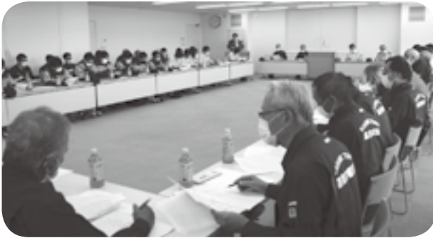
嘉島町災害対策会議及び水防協議会

ことしは6月11日に梅雨入り。福岡管区気象台によりますと、8月まで3カ月の降水量は平年並みが見込まれています。また、線状降水帯の予測は、6月1日から始まった新しい取り組みで、発生が予測されると半日前に広域の予測情報が提供され、早めの避難が呼びかけられます。