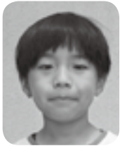
いしざかりつ (嘉島西小1年)