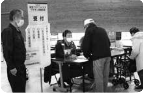
町民体育館で始まった集団接種を見守った