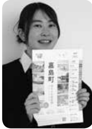
3年ぶりに改訂された嘉島町「暮らしの便利帳」

◇お断り 「嘉島町民会館ホール『アクア』催し案内」は新型コロナウイルスに伴い、掲載を見合わせました。