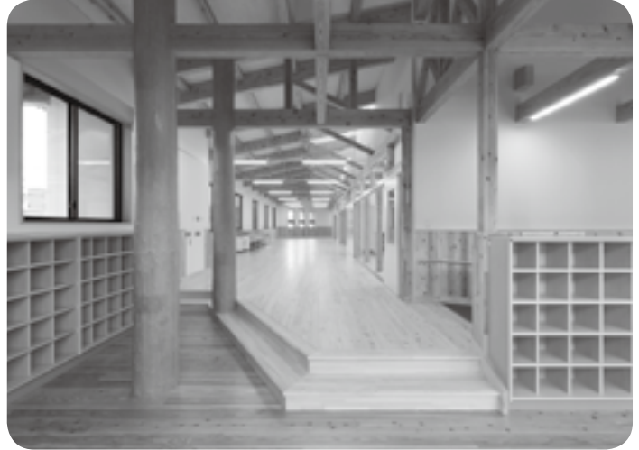
木の香りが漂い、ぬくもりあふれる西小増築棟