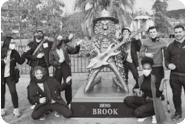
勢ぞろいした仲間たち