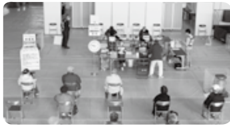
町のワクチン集団接種から