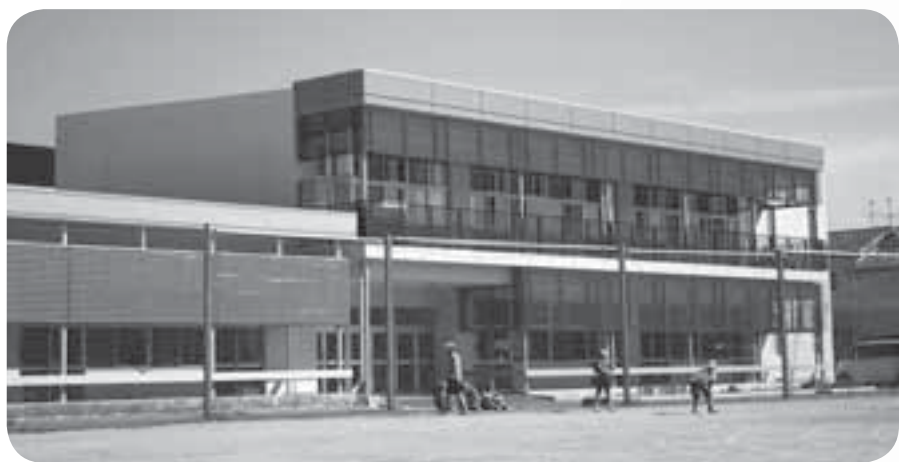
今年2月に竣工した嘉島西小の新校舎