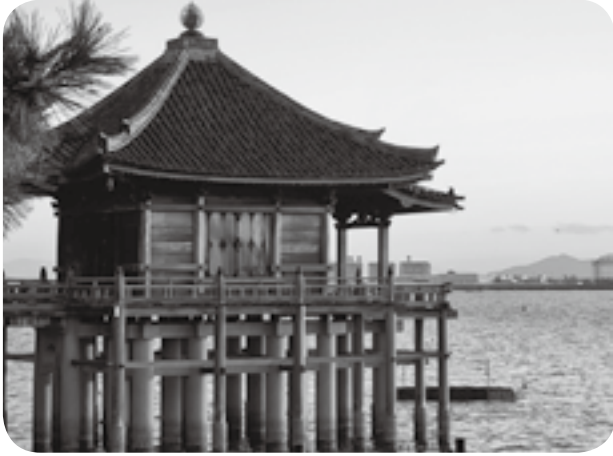
きれいでしょ。旅した先は…