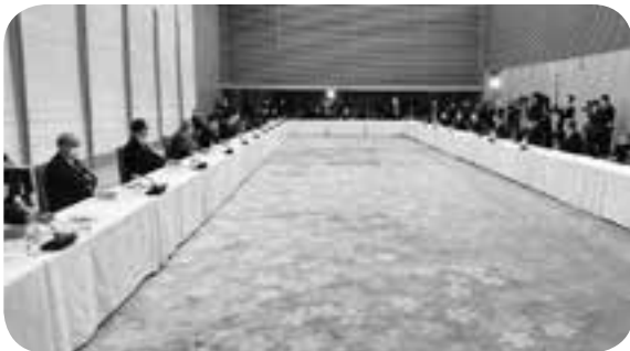
地方6団体の代表として官邸で開かれた国と地方の協議の場に臨んだ