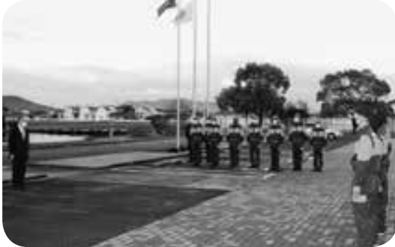
消防学校で行われる幹部研修のため入校する町消防団の幹部団員らを激励した