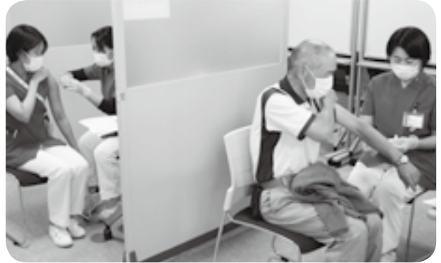
熊本回生会病院で医療従事者らを対象に始まった新型コロナウイルスの3回目ワクチン接種