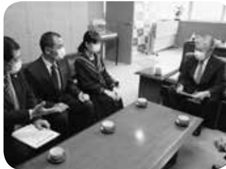
全国ジュニア料理レシピコンクールで最高賞受賞報告を喜ぶ荒木町長