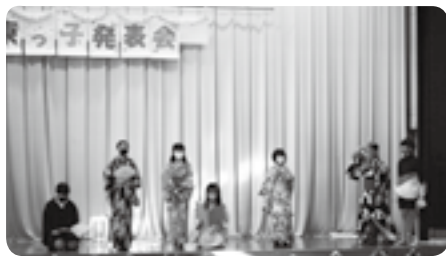
東っ子発表会から