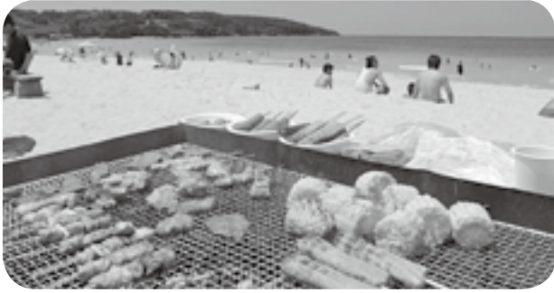
おいしそう！ ビーチのごちそう