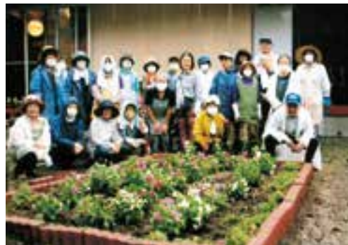
嘉島町北甘木「みんなの家」