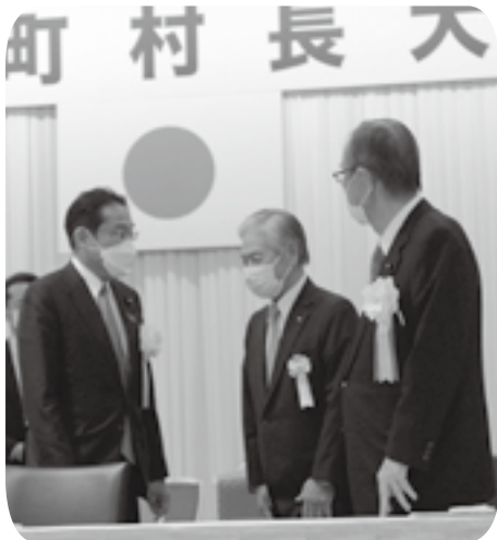
岸田文雄総理大臣（左）と細田博之衆議院議長（右）とともに全国町村長大会に臨んだ