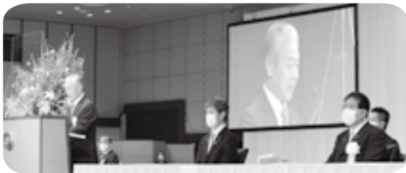
全国町村会創立100周年記念式典で希望に満ちた地域づくりを呼び掛けた。来賓席には金子恭之総務大臣も