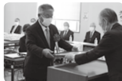
社会福祉功労者を表彰