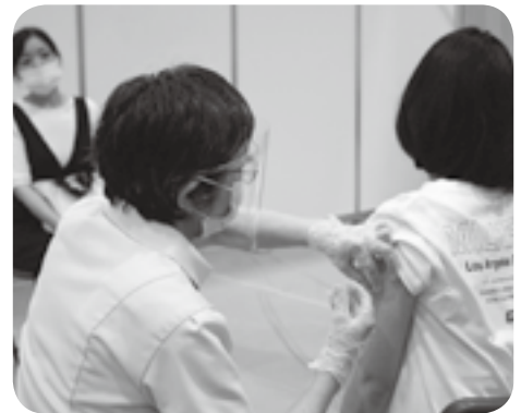
接種対象年齢が引き下げられ、中学生は保護者が付き添って接種を受けた

嘉島町が進める新型コロナウイルスワクチンの町内接種率（1回目）は8月末時点で80.0%（暫定値）となり、町は「感染防止のため接種に協力を」と呼び掛けています。