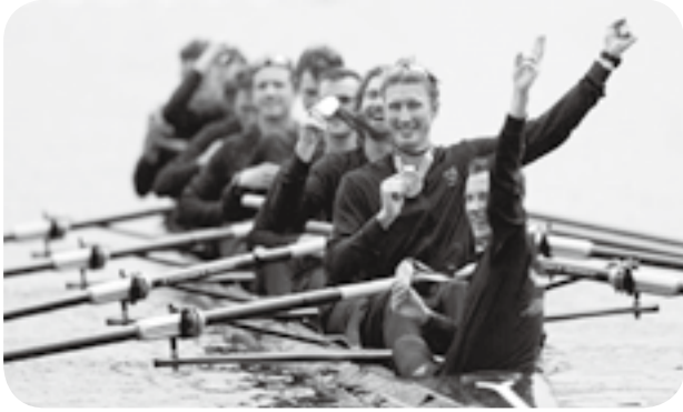
やった！ 母国ニュージーランドの…