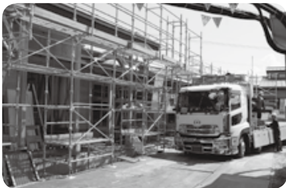
西小で進む校舎増築工事