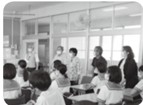
講師陣もそろった町「地域未来塾」開塾式