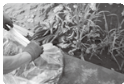
旧矢形川へのワナギ放流