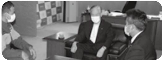
町消防団長からの報告を受けた