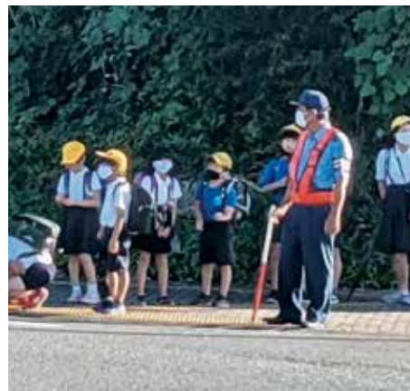
秋の全国交通安全運動中(9月21日~9月30日)