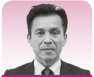
満田 和浩 議員