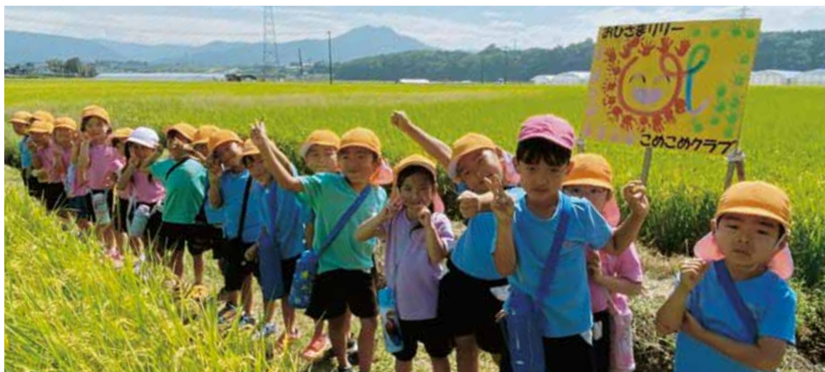
こめこめクラブ(おひさまリリー保育園)