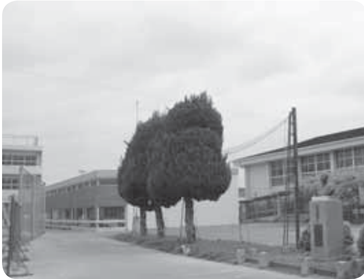
嘉島西小。左側新校舎につなぐ形で、2階建て4教室分が中央の樹木右側駐車場に増築されます