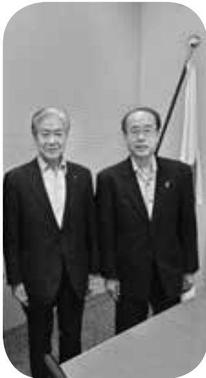
ワクチンなど担当する和泉洋人・内閣総理大臣補佐官を官邸に訪ねた