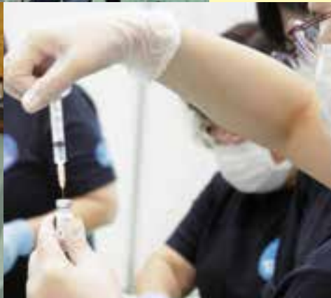
嘉島町の新型コロナウイルス ワクチン集団接種が町民会 館で始まった(組み写真)。