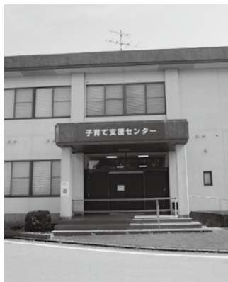
(子育て支援センター)