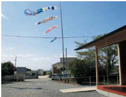
今年も元気に泳ぐこいのぼり（上六嘉公民館）