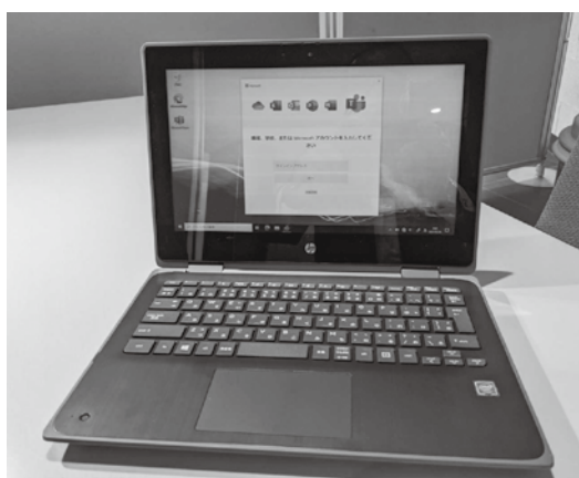
(授業で使用するタブレット端末)

これらの情報機器の使い方について、学校はもちろんですが、家庭での使い方についても、ルールを決めて適切に使用することが大切であると考へ、保護者にも協力を求めて行きたいと考えています。