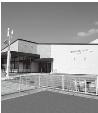
(嘉島町ふれあいセンターイースト)

伝事業、かしま水の郷まつり助成事業」を、平成27年度補正予算・地方創生加速化交付金については、「プロモーション動画の制作や空き家バンクのシステム整備、移住定住促進のパンフ作成」、平成28年度補正の地方創生拠点整備交付金では、「ふれあいセンター整備」事業を行っています。また、今年度が、本計画の最終年度であり、現在次期計画の作成にあたっては、町民の皆様方をはじめ企業や関係団体と一体となって全力で取り組んで参ります。