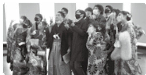
嘉島町成人式から