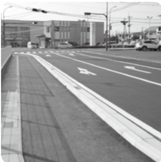
右折レーンに歩道も新たに整備された 上島のケーズデンキ北側交差点

やがて熊本地震から5年—嘉島町は被災した各種公共施設の復旧をこれまでに終え、次代を見据えた地域振興「ネクストステージ」への施策を展開しています。