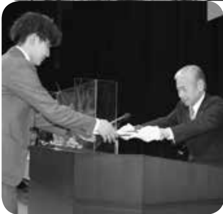
町成人式の式辞（写真上）で新成人たちに エールを送り、代表者に記念品を手渡した （同左）