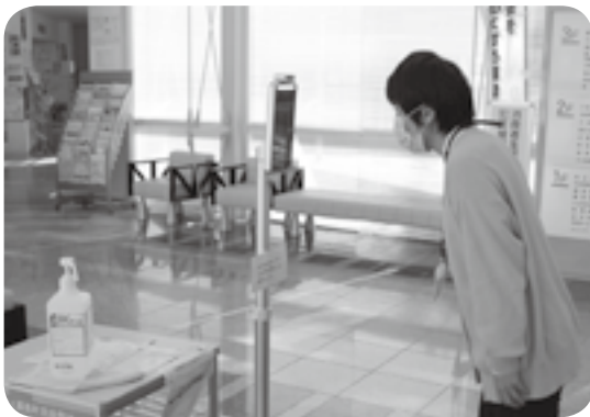
来庁者の体温チェックのため役場エントランスに設置されたサーマルカメラ

出した緊急事態宣言と、今回の県宣言に従い、町も防災行政無線で外出自粛など感染防止呼び掛けの放送を再開し、職員を班分けして交代で在宅勤務するリモートワークも推進。また、クラスターを警戒する町内小中学校の水道蛇口の自動センサー化を検討したり、町総合運動公園はじめ町有施設の利用取り決めに徹底したりして感染防止に万全を期していく方針です。