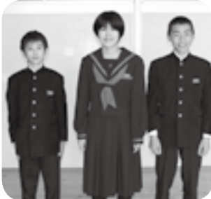
写真上は生徒会の新たな三役、同左が正副議長、そして各委員会の委員長（同下）