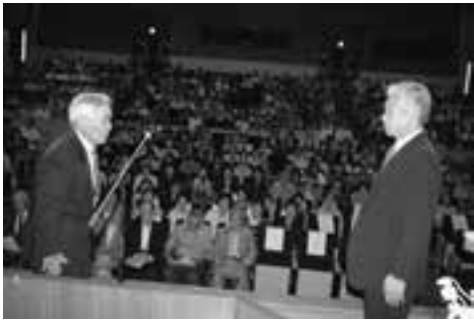
ご長寿を祝う町敬老会から