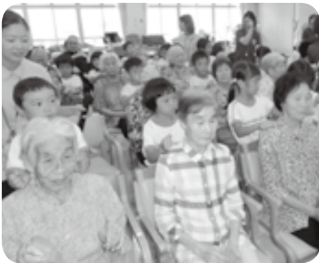
園児らの肩たたきに涙ぐむお年寄りも