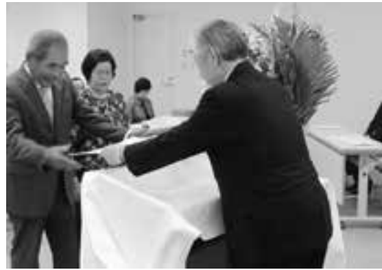
金婚式を迎えたご夫婦に表彰状や記念品を贈る

併せて、金婚式では半世紀にわたり、共に手を携えてこられたご夫婦の歩みに祝意を表する一方、既に伴侶を亡くされた方の結婚50周年表彰も執り行いました。式典に臨まれた皆さんの表情はそれぞれ万感にあふれ、過ぎし日々を振り返るようにもお見受けしました。人間模様が織り成す思いは喜びに悲しみ、さまざま。震災から何度も来町いたたく静岡県のボランティアグループ「茶の国会議」の皆さんの思いは「被災者のため」に尽きるようです。今夏も足湯サービスを通じたスキンシップと語りいで町民と交歓。嘉島への支援活動を契機に「グ