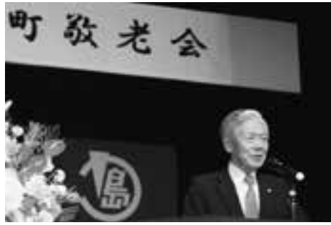
町敬老会でお祝いを述べる

今年も敬老の日（9月16日）にちなみ、ご長寿をお祝いする町の行事が相次ぎました。世紀に及ぶ偉業となる百歳表彰に、おなじみ米寿祝いを兼ねた敬老会。