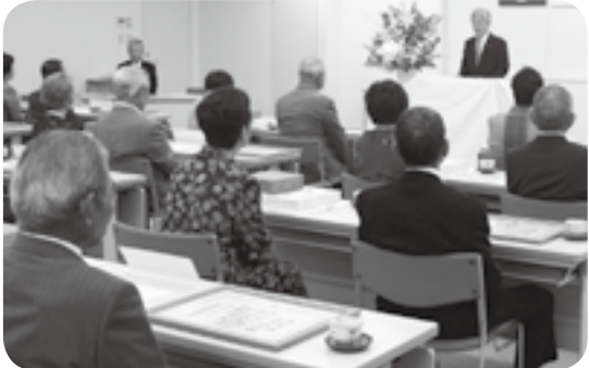
町内の金婚夫婦を招いた金婚式で お祝いを述べる荒木町長