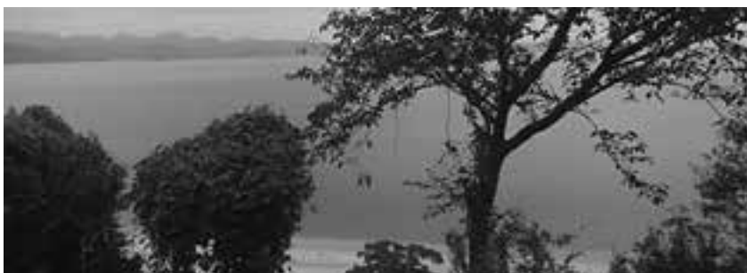
新たに来日した県内ALTの歓迎パーティーが開かれたビーチ