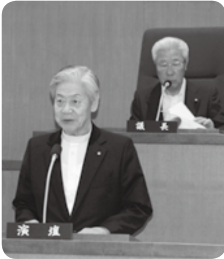
令和となって初の町議会で町政報告を行う荒木町長

嘉島町議会の令和元年第2回定例会は6月4～6日の3日間の日程で開かれ、元年度一般会計補正予算案はじめ追加提案を含む全15議案（条例9件、予算2件、その他4件）をいずれも原案通り可決承認しました。