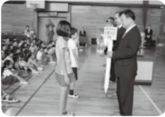
人権擁護委員らから花の種など受け取る嘉島西小の児童たち（左側）