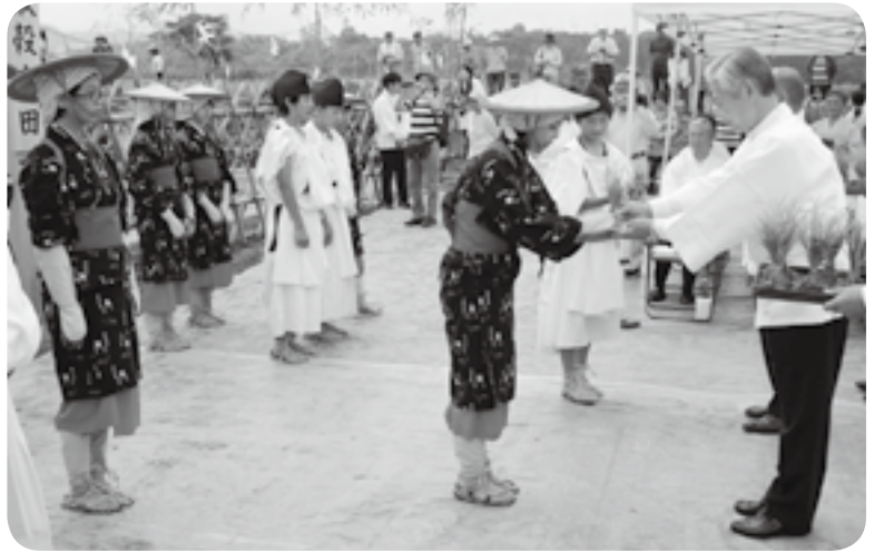
荒木町長から稲の苗を受け取る田男、早乙女姿の嘉島中の生徒たち（左側）