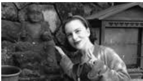
よ〜く見て！ 石仏さんの足元に…

Last weekend, on June 8th, I went to Fukuoka. In Fukuoka, I saw a kabuki performance at Hakataza Theater. This was my first time seeing kabuki. I saw three different plays. I saw Yaegiri Kuruwa Banashi, Tsuchigumo, and Gonza to Sukeju. My favourite performance was Tsuchigumo. I thought the spider was amazing and all of the actors were very good. I'm happy I got to see a kabuki performance in Japan. In Fukuoka, I also went to a Buddhist temple and that was also a lot of fun. Until next month!