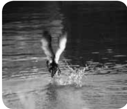
大切にしていきたい水の郷、嘉島の情景から

今年も梅雨、台風と、風水害が気掛かりな時季。麦刈りから田植えと続く農繁期の空模様には気をもみ、「災害なく豊かな実りをも」という願いは平成と同様、令和も変わりません。 「災害の時代」とも言われる平成。ただ嘉島町の場合、人口や企業誘致など各種の統計データは「まさに飛躍する町」を指し示しています。 この町の勢いを「令和へつないでいく」との思いを新たにしました。先に本欄で報告したように新天皇ご即位にちなむ皇室行事に参列して連綿と受け継がれる伝統に触れ、守るべきものについて考えさせられたせいでしよう。 都内の喧（けん）騒を忘れさせる宮中の静寂、こんもりとした緑の中、思い浮かん